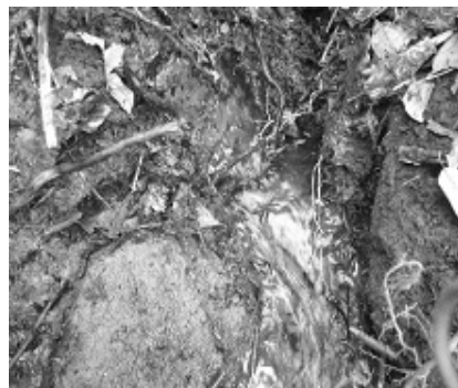
nejvydatnější pramen Lesního potoka

Na území Malých Svatoňovic pramení Mariánský potok. Jeho prameny se nacházejí nad Mariánským sadem a jsou v podstatě dva. Vyvěrají téměř na konci rokle, která se táhne podél Mariánského sadu a končí v místech, kudy se dostanete k domku Teichmanových čp. 106, kde se také říká „v Dalmácii“. Pro orientaci lze použít pohled z místa, kde se scházejí dvě cesty. Jedna vede kolmo nad Mariánským sadem a setkává se s asfaltovou komunikací jdoucí od Benešovy chaty. Podíváte-li se přibližně východním směrem uvidíte buk čnící nad roklí a vlevo od něho stojí, zatím, bříza. Tak v těchto místech jsou v houštině, dva docela silné prameny. Tyto prameny jsou vyznačeny na vodohospodářské mapě. Je pravda, že v době tání sněhu, nebo dlouho trvajících dešťů je