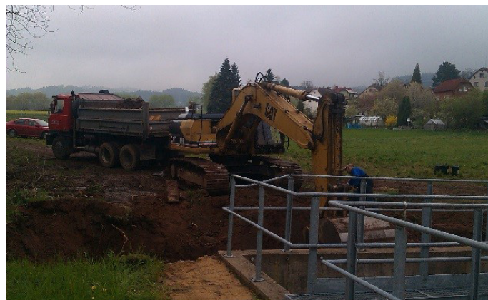
Stavba ČOV na Jestřebci už začala.