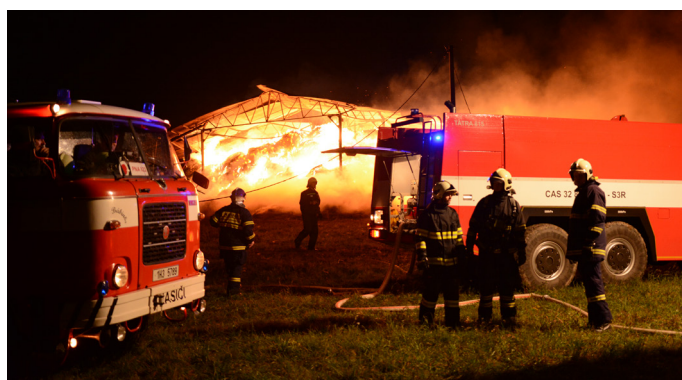
Zásah Markoušovice

V tomto roce jsme jednotku znovu přihlásili do kategorie sborů, ve které nás bohužel porota do finále a veřejného hlasování neposlala. Oproti loňskému ročníku jsme se ale přihlásili také do kategorie jednotek, a to s náročným zásahem u hořícího stohu v Markoušovicích, za který nás porota nominovala do finálové pětky , v níž budeme jako jediní zástupci Královéhradeckého kraje znovu bojovat o jednu ze tří hodnocených příček!!!