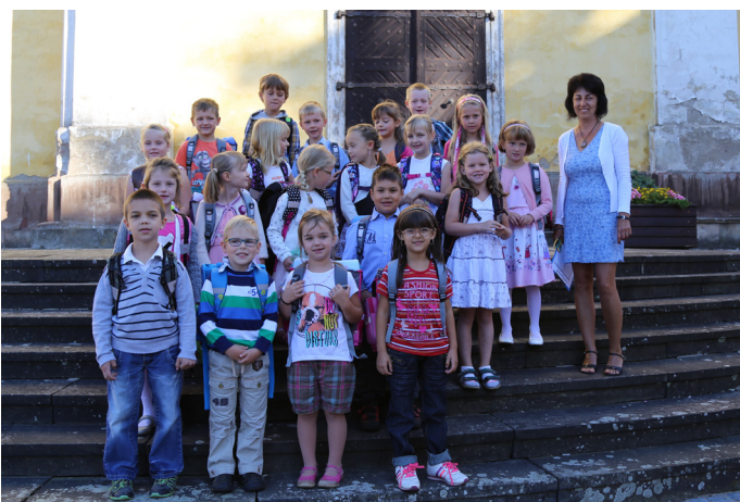
Prvňáčci