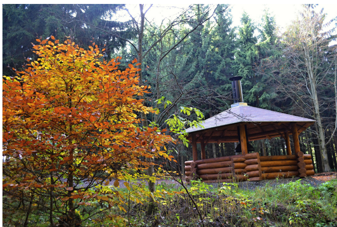
Altán u Bílého kůlu

Nenáročný výlet je plný barev a doporučujeme ho hlavně pro rodiny s dětmi, ale samozřejmě může vyrazit kdokoli, kdo má rád barvy podzimu. Taky fotografové si určitě přijdou na své. Z Malých Svatoňovic je dle jízdního řádu o víkendu odjezd v 9:05 nebo pro spáče v 11:50. Autobusem vyjedete pohodlně na zastávku Odolov hostinec, odkud se vydáte přes silnici k věznici, kde se napojíte na známou Panskou cestu. Panská cesta je určitě všem velice dobře známá, ale v podzimním svitu slunce a barevném hábitu ji uvidíte maximálně 14 dní