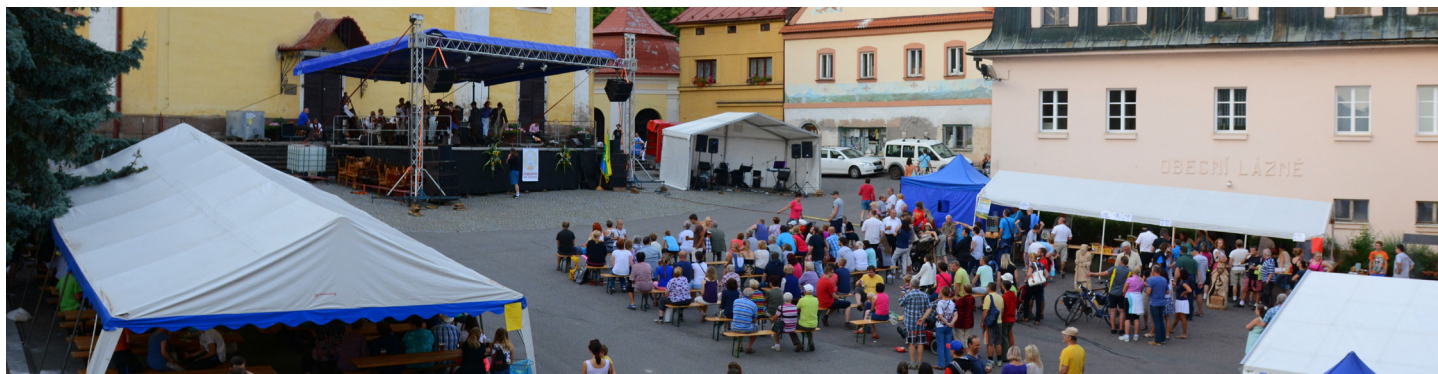
Den obce 2016 (autor: Petr Farský)