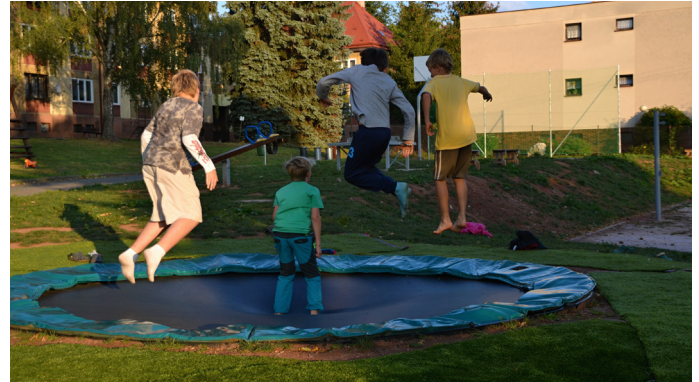
Trampolína je stále v obležení dětí

Vstupem na trampolínu souhlasíte s provozním řádem a jeho dodržováním. V případě poškození trampolíny , plynoucího z nedodržení bodů provozního řádu, je uživatel povinen škodu v plné výši uhradit .