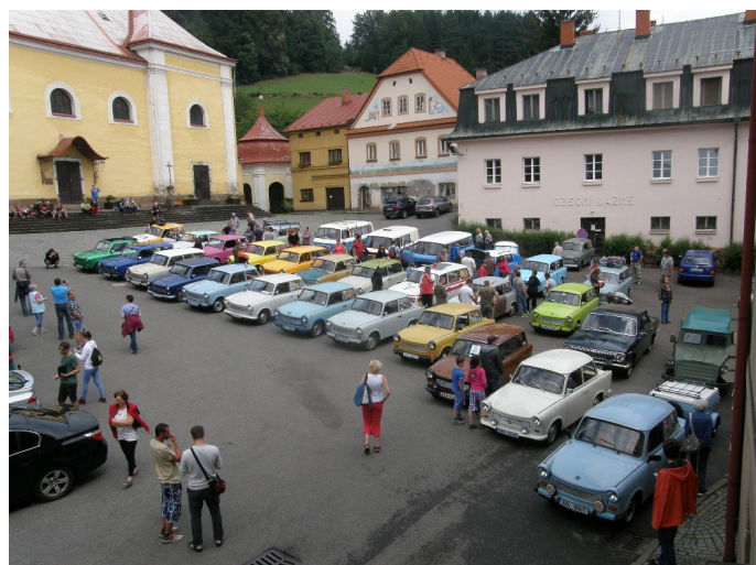
Trabanty na náměstí