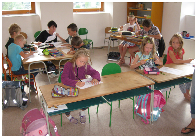
Školní výuka v Mraveništi

Pilně se celé léto pracovalo na rekonstrukci budovy bývalé školy (ještě nedávno ústavu sociální péče) v Markoušovicích, aby tam mohla začít fungovat naše základní škola i dětská skupina. Jsme moc rádi, že se nám to společnými silami podařilo a velmi si vážíme pomoci i podpory všech zapojených dobrovolníků. Teď si prostor zabydlují děti a místo stavebního ruchu je slyšet dětské výskání.