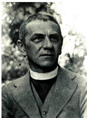
P. Hlína

Oslavy dvouletého jubilea dle záznamů P. Stanislava Hlíny, duchovního správce poutního kostela