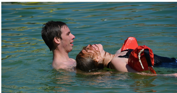
Bezpečnostní den 2016

Sbor dobrovolných hasičů Malé Svatoňovice uspořádal 24. června 2016 v areálu koupaliště a školy BPA Bezpečnostní den. Tento den byl určen pro veřejnost a děti základních a mateřských škol z Malých a Velkých Svatoňovic.