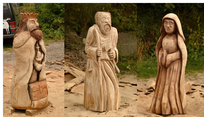
Sochy zůstanou zapůjčené obci