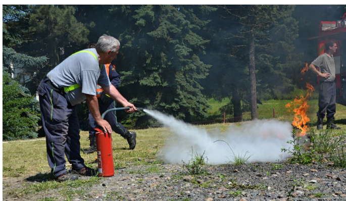
Bezpečnostní den 2016

Akce se zúčastnily tyto složky bezpečnostních sborů: Policie ČR Trutnov, Báňská záchranná služba Odolov, Vodní záchranná služba Náchod, SDH Malé Svatoňovice a SDH Červený Kostelec.