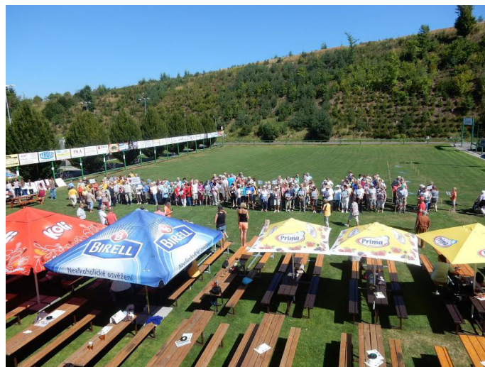
Olympiáda v Havlovičích

Dne 1. 9. 2016 odpoledne se v Havlovičích uskutečnil již 8. ročník Olympiády pro starší a dříve narozené. Této Olympiády se zúčastnilo 10 členek Klubu důchodců naší obce. Účelem nebylo vyhrát, ale zúčastnit se, trochu si zasportovat a hlavně se pobavit. Odpoledne svým vystoupením zpestřili country tanečníci, pro účastníky bylo připraveno občerstvení. Akce se našim účastnicím moc líbila a už se těší na další ročník v příštím roce.