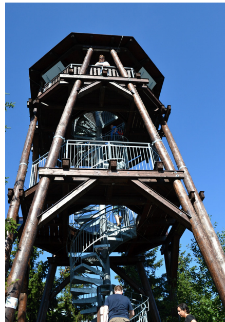
Rozhledna Čáp

Kdybyste stáli na konci éry druhohorní na pískovcové plošině, jež byla dnem křídového moře, stěží byste uvěřili, že tam dole pod vámi bude za cca 80 miliónů let čilý turistický ruch. Matka příroda tu začala tvořit své kolosální výtvořky a za pomoci vody, slunce a větru postupně vytesávala do masivu skalního jeho tvář a měnila tak ráz celé krajiny této.