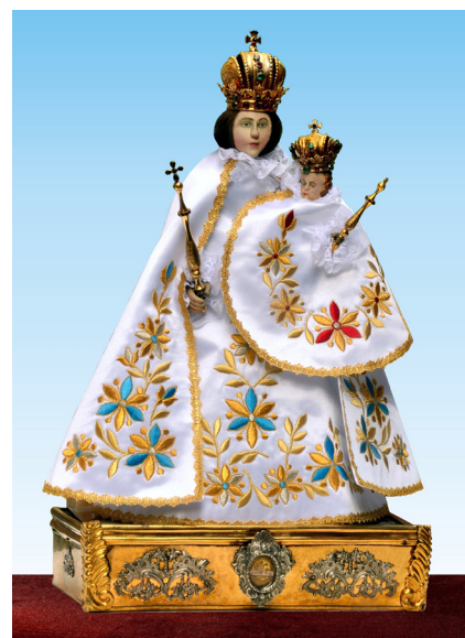
Nové šaty

Velkému zájmu poutníků se také těšil pamětní obrázek vydaný k jubileu poutního místa. Obrázek je možné zakoupit v kostele nebo v Muzeu bří Čapků.