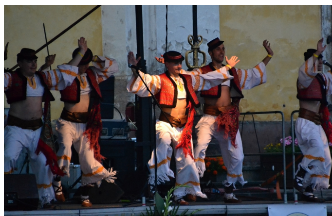
Folklorní skupina ze Slovenska