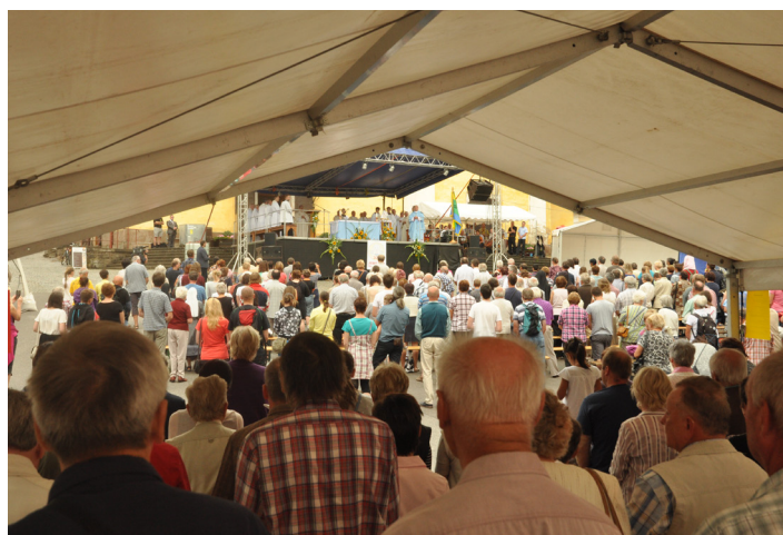
Diecézní pouť 2016