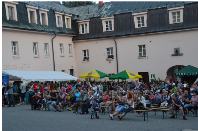
Zaplněné náměstí při bohatém programu

Na reportáž ze Dne obce se můžete podívat na: http://www.televize-js.cz/clanky/male-svatonovice/male-svatonovice-den-obce-2016