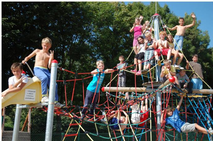
Školní výlet 5. třídy

Nejlepším začátkem pro vzájemné poznání je určitě školní výlet. Zvolili jsme blízké okolí – Havlovice. Naučili jsme se hrát minigolf a jezdili na koloběžkách. Nejvíce nás ale nadchla