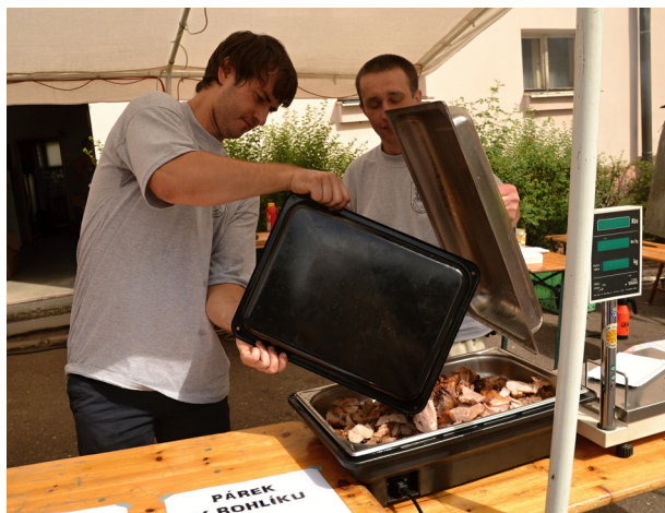
Maso bylo vynikající

Den obce se mě i mým malým dětem moc líbil, smekám před všemi organizátory, kteří dokázali sladit hudební repertoár, gurmánský zážitek v podobě bramboráků a vyžití pro děti. Moje dcera si vyzkoušela lanový park a podívala se na loutkové divadlo. Syn, kterému jsou dva, ocenil výběr kapel a tančil po celém náměstí. Já jsem si zavzpomínala na mládí při hitech 80. let při vystoupení kapely Jam&Bazar.