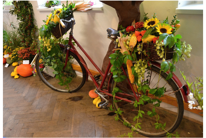
Čapkova zahrádka 2016