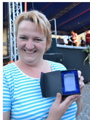
2. místo v soutěži O nejlepší Studánecký bramborák

Na starých fotografiích je náměstí o pouti plné stánků a lidí, myslím, že po dlouhých letech se opět náměstí naplnilo lidmi a těmito starými fotografiím se značně podobalo. Podle mého názoru se Den obce povedl a myslím, že by se mohl stát dnem, ještě společně s první adventní nedělí, kdy se lidé spolu potkávají na našem malém, opotřebovaném, ale mystikou opředeném náměstí. Mám ráda, když se lidé znají, zdraví se, povídají si spolu a také se na sebe usmívají, a to vše na Dni obce bylo, takže já jsem spokojená. Naše děti byly nadšené z provazového hřiště a můj manžel z grilovaného masa od hasičů. I jako zahrádkáři jsme byli spokojeni, naše koláče zmizely během chvilky a většina lidí se u nás zastavila s nějakou příhodou, či dotazem na pěstování čehokoli... Už mám vymyšlené, co by mohli zahrádkáři příští rok smažit dobrého na zub.