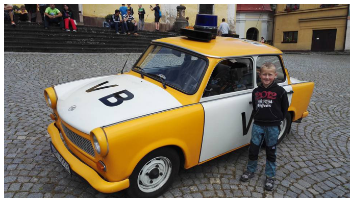
Trabanty na náměstí (autor: P. Nosek)