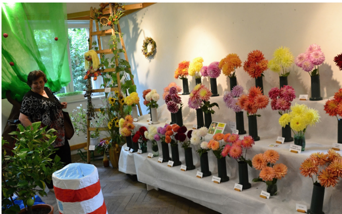
Čapkova zahrádka 2016

Když končila minulý rok v září naše výstava, už jsem věděla, jaké bude příští téma - „letem světem“, a celý rok jsem vymýšlela a tvořila dekorace k tomu potřebné. Inspiroval mne model kolejiště mého manžela a dalo mi nejméně práce přesvědčit ho,