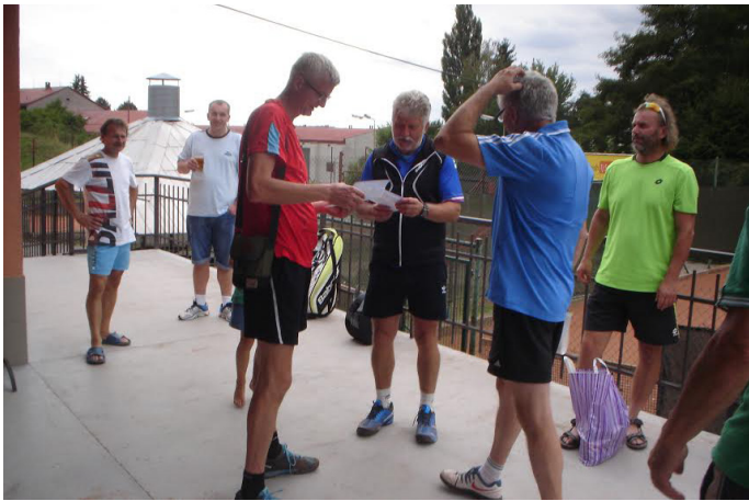
Předávání cen vítězům

Víkendový turnaj proběhl za krásného, slunného počasí, v příjemné atmosféře. Jediným negativem byla nízká účast. Turnaj s dlouholetou tradicí má v poslední době klesající účast, a to je velká škoda.