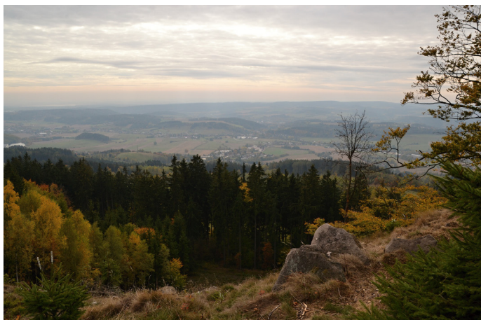
Výhledy do krajiny

Než nám přijede Martin na bílém koni, určitě se vydejte na podzimní výlet do přírody, kterou máme přímo za humny. Už pohled na začínající barevné Jestřebí hory z Malých Svatoňovic k tomu přímo vyzývá.