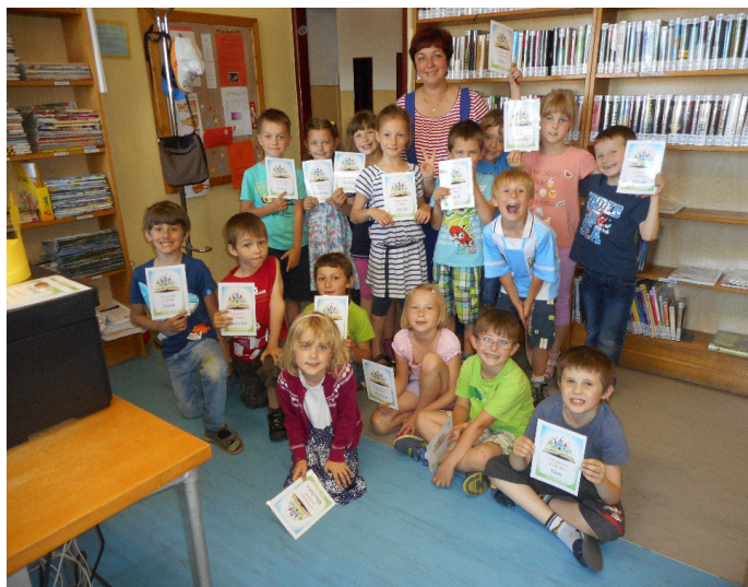
Pasování na čtenáře

Poté si děti zkusily poznávat písmenka. Dostaly do ruky vystřižené písmeno a musely pohmatem, se škraboškou na očích, uhodnout, které to je. Děti to hodně bavilo.