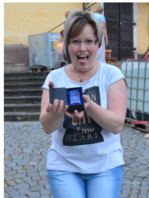
3. místo v soutěži O nejlepší Studánecký bramborák

Jak byste zhodnotili letošní Den obce a máte popřípadě nějaké návrhy, které by mohly vylepšit pořádání dalších akcí? Co se vám nejvíce či nejméně na akci líbilo? Byli jste spokojeni s programem, občerstvením a zázemím pro celou akci?