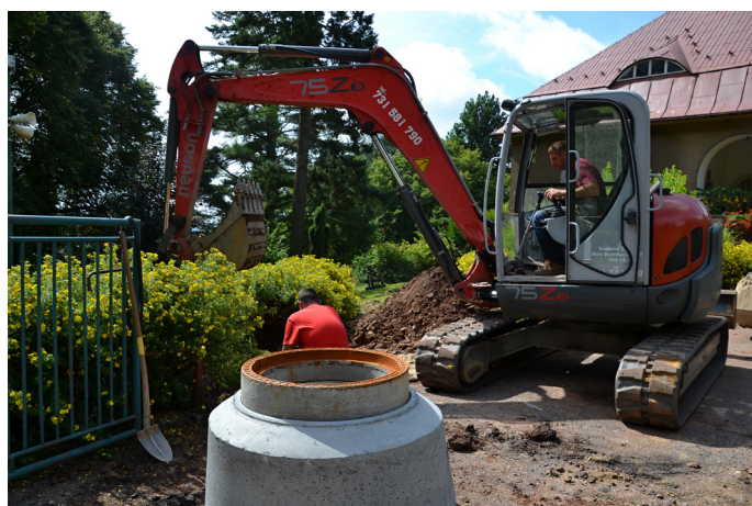
Výstavba kanalizační přípojky u budovy horní školy

Budova Základní školy 1. stupně byla v předposledním prázdninovém týdnu připojena kanalizační přípojkou na veřejnou část kanalizace. Veškeré práce zajistila firma Stanislav Vyhldil z Malých Svatoňovic. Celková částka vynaložená na tuto přípojku je 427 535 Kč. V příštím roce bude nutné ještě vyměnit povrch nádvoří (asfalt) před touto budovou.