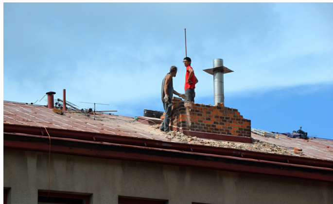
Výměna střešní krytiny na ZŠ 2. stupeň

V minulém týdnu byla dokončena výměna střešní krytiny na objektu Základní školy 2. stupně. Veškeré práce zajistila firma REST TU s.r.o. z Trutnova. Střecha je plechová z materiálu Prefalz. Celkové náklady na novou střešní krytinu včetně všech prvků a nového komínu jsou 909 315 Kč vč. DPH.