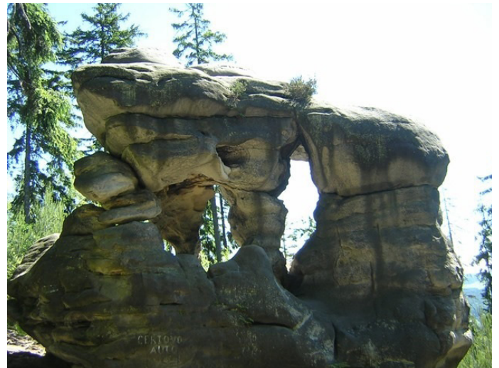
Čertovo auto na Ostaši

tajemných promítly, ale i též historii novodobější, tudíž člověčí, která se v podobě skalních zřícenin hradních zde též nachází. A když se vyšplháš na nejvyšší bod, který se Čápem nazývá, tak z rozhledny tamní budeš mít tuto oblast Čech východních jak na dlani.