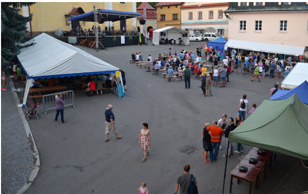
Lidé korzovali a bavili se