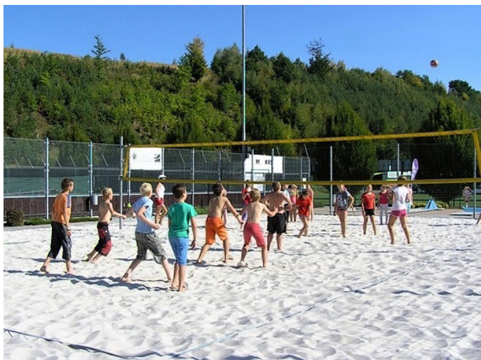
6. třída na seznamovacím výletu

První část byla cesta do Úpice, kde jsme navštívili hvězdárnu. Prezentace o sluneční soustavě zaujala opravdu všechny. Dále podle plánu jsme se šli podívat dalekohledem na oblohu. Měli jsme uhodnout, co zrovna sledujeme. Nebyla to práce lehká, protože se tečka ani nehnula. Kdosi z davu vykřikl: „Je to Venuše!“ „Ano, je to Venuše,“ potvrdil pan průvodce. Pak jsme se koukali na Slunce. „Na Slunce se nemůžeme koukat přes normální dalekohled, protože by nám to vypálilo oči,“ upozornil nás pan průvodce. Slunce jsme si tak promítali na bílý papír. Byla to velká žlutá koule bez jediného černého flíčku. Dokonce jsme i pomocí dalekohledu a promítačky propálili papír. To pobavilo a ohromilo všechny.