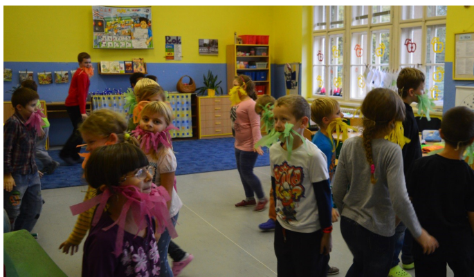
Školní projekt

Ve dnech 20. až 21. 10. 2016 se na I. stupni základní školy uskutečnil pravidelný podzimní projekt o strašidlech. Cílem projektu je vždy utužit kolektivy dětí, rozvíjet kamarádské