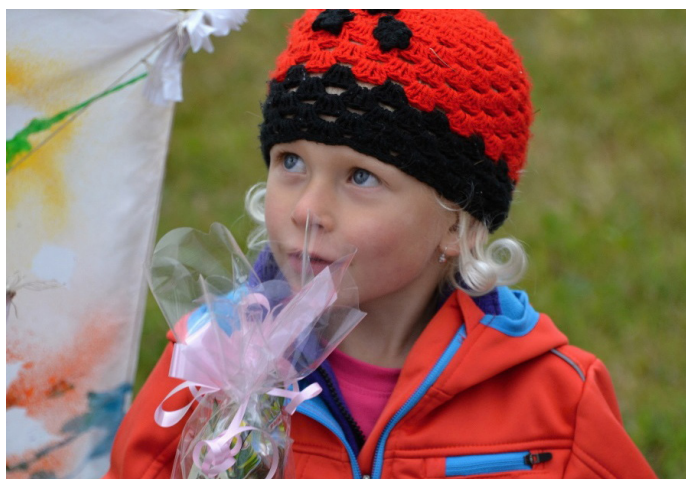
Vítězka nejhezčího ručně vyrobeného draka 2016