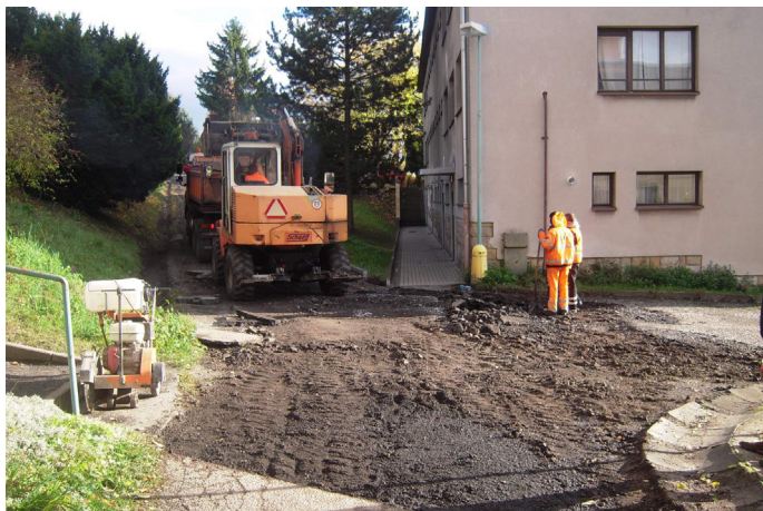
Rekonstrukce komunikace ke koupališti

Ve dnech 3. až 9. listopadu byla provedena rekonstrukce dvou úseků místních komunikací. Jedním z úseků je komunikace směrem ke koupališti a druhým úsekem je komunikace k Turkovým.