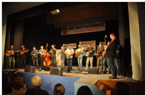
Sobotní koncert 2016

Na jamování je nejpůvabnější sestava lidí, které svedla dohromady náhoda a touha si zahrát. Vedle lektorů vidíte žáky v různém stupni pokročilosti a s různým sebevědomím. Myslím si, že každý pokus o přenos jamu na internet by uškodil bezprostřednosti této chvíle. A pro návštěvníky je nejpůvabnější procházet se jednotlivými místnostmi klubu a přilehlými hospůdkami a sledovat všechna ta náhodná uskupení.