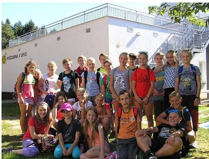
6. třída na seznamovacím výletu