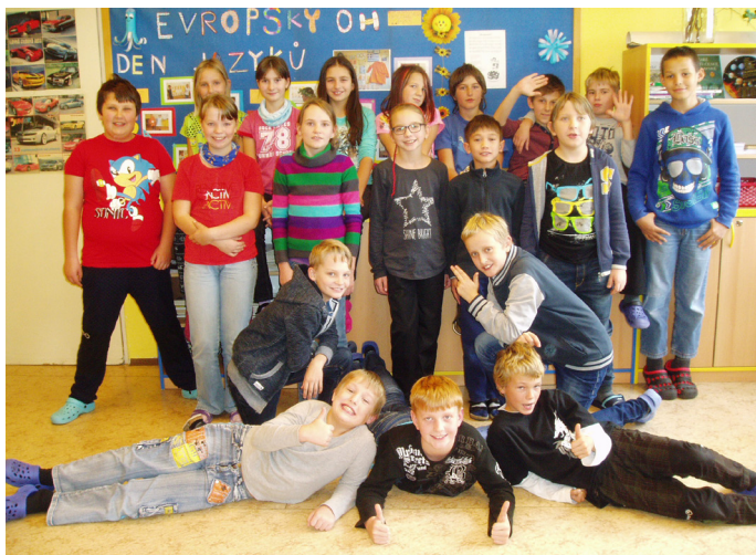
5. třída se již adaptovala (autor: E. Brátová – třídní učitelka)

Těch změn pro ně bylo mnoho – nová škola a nová třída, noví spolužáci, noví učitelé včetně paní učitelky třídní, nové požadavky na výuku v jednotlivých předmětech. Děti si zkusily zahrát na reportéry a položily si mezi sebou pár otázek, týkajících se dění ve škole: