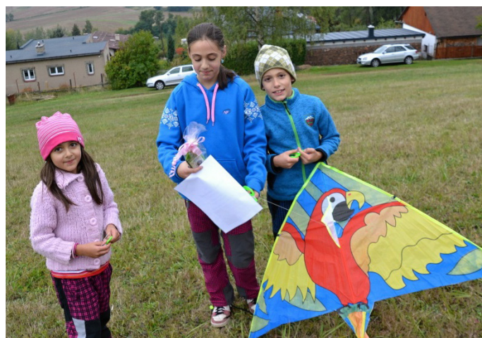
Nejvytrvalejší letci Drakiády 2016