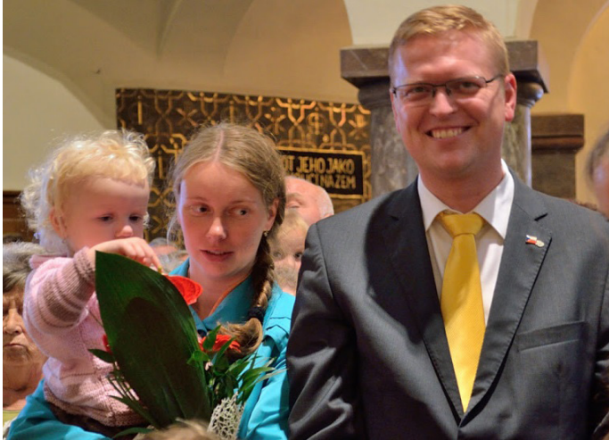
Pavel Bělobrádek v Malých Svatoňovicích