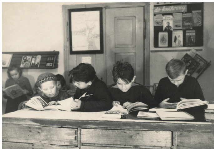
V knihovně