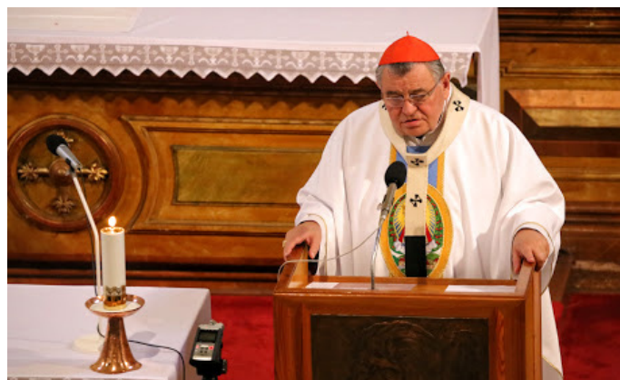
Dominik Duka v Malých Svatoňovicích

Oslavy 300. jubilea mariánského poutního místa v Malých Svatoňovicích zakončila slavnostní mše svatá, kterou v neděli 2. října 2016 celebroidl pražský arcibiskup Dominik kardinál Duka.