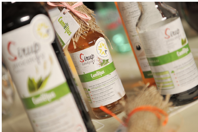
Bylinné sirupy