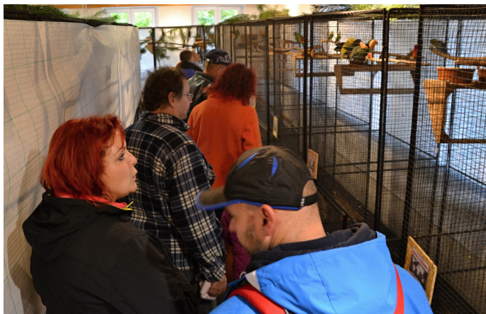
Návštěvníci měli co obdivovat