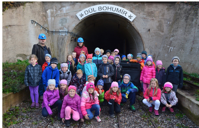
Školní projekt

chování mezi dětmi, naučit se něco nového a v neposlední řadě si pohrát a trochu se i bát. Povíдали jsme si i o hornictví ve Svatoňovicích, navštívili štolu Kateřina a součástí projektu byla i exkurze do měděného dolu Bohumír, kde si děti prověřily své