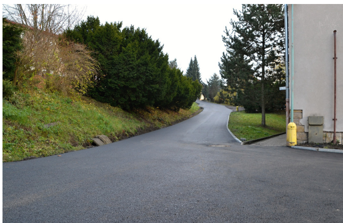
Nová silnice ke koupališti

Rekonstrukce je provedena metodou Road Mix – podklad ze zeminy upravené hydraulickými pojivy v tloušťce 30 cm. Vrchní povrch je živičný (asfaltový) v tloušťce 6 cm. Komunikace k ČOV je v hodnotě 602 539 Kč vč. DPH a komunikace k Turkovým je v hodnotě 491 609 Kč vč. DPH. Veškeré práce provedla společnost Repare Trutnov s.r.o.