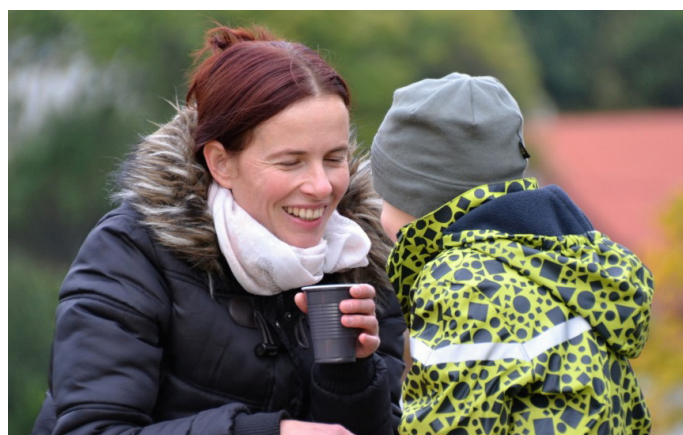
Dobrá nálada na Drakiádě 2016