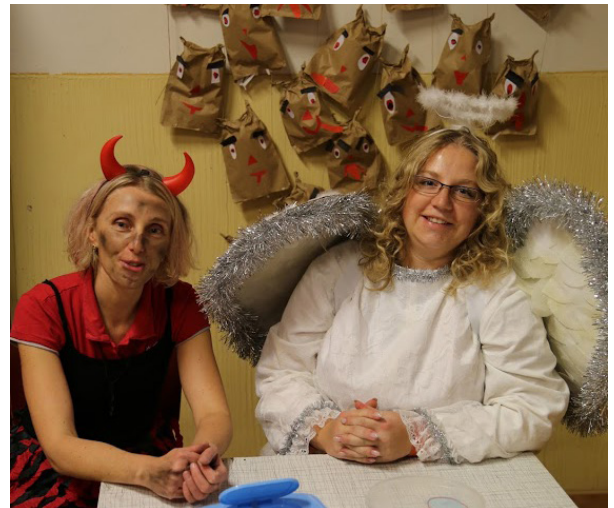
Čertice s andělem - Advent u Studánky 2015

Jedna z našich největších akcí v tomto roce nás teprve čeká – už tradiční čertovský rej, který se koná první adventní neděli. Letos je to 27. 11. a čertovský rej bude opět součástí Adventu u Studánky. Jako každoročně vymyslíme pro děti nové soutěže