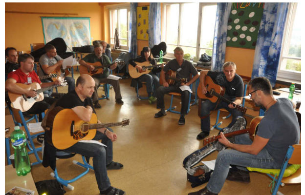
Bluegrassová dílna 2016 – výuka