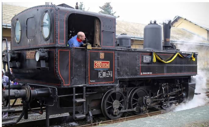
Příjezd parního vlaku