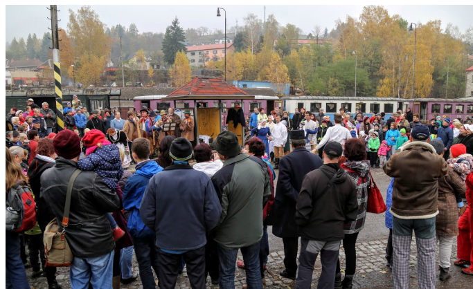
Akce přilákala mnoho diváků