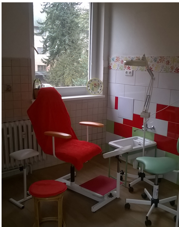
Nová pedikúra

Z legislativních důvodů bylo nutné zajistit odpovídající projektovou dokumentaci na změnu užívání včetně vyjádření Krajské hygienické stanice a Hasičského záchranného sboru. V současné době se již vyřizuje změna užívání u příslušného stavebního úřadu. V nových provozovnách byla upravena elektroinstalace, rozvody vody a kanalizace a vyměněna podlahová krytina. V současné době se dokončují úpravy, na kterých se už podílejí budoucí provozovatelky.