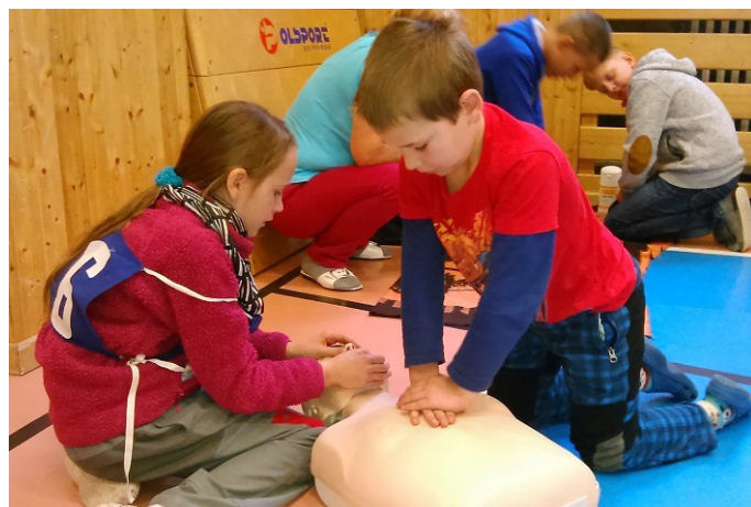
Mladý zdravotník

Školení proběhlo v pátek 7. 10. 2016 na lesnické škole v Trutnově a účastnilo se ho dvacet žáků ze zdravotního kroužku naší školy. Zdokonalovali své dovednosti v poskytování první