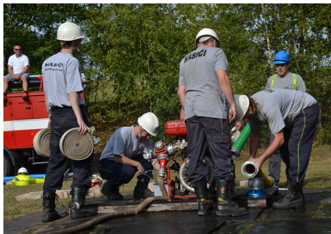
SDH Malé Svatoňovice