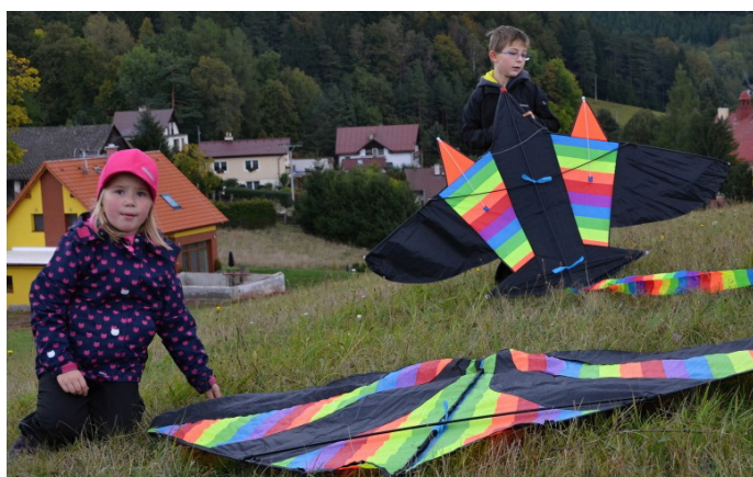
Neletí a neletí