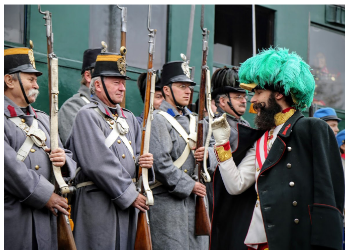
Císař ve Svatoňovicích 2016

Do Malých Svatoňovic v neděli 6. 11. 2016 zavítala slavná návštěva – císař František Josef I. a jeho generální štáb. Přijeli na místní nádraží parním vlakem v rámci kulturní akce ke 150. výročí prusko-rakouské války r. 1866 pořádané Komitéttem pro udržování památek z války roku 1866 a Železničním muzeem Výtopna Jaroměř.