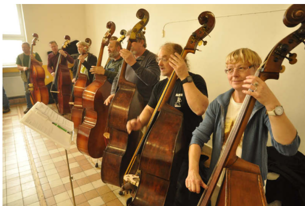
Bluegrassová dílna 2016 (autor: J. Hylmar)