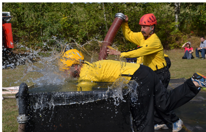
SDH Trutnov - Horní Staré Město

První místo v družstevch mužů si z hasičského hřiště odnesl SDH Třebihošť. Z družstev žen vyhrál SDH Vlčice. Ocenění dostalo názvu soutěže a první tři družstva mužů a žen se mohli těšit z Posvícenského koláče. Cenou útěchy pro ostatní byly malé koláčky k ochutnání.