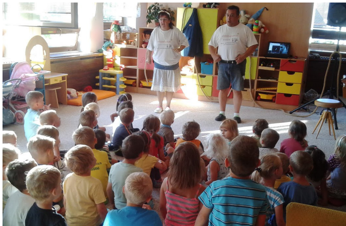
Divadlo ve školce

Pro zpestření začátku v mateřské škole k nám přijeli herci s programem Jaké byly prázdniny. Děti si zazpívaly, aktivně se zapojily do hry a získaly drobné odměny.