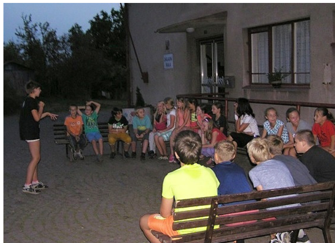
6. třída na seznamovacím výletu

Druhý den po vydatné snídani jsme se oblékli do sportovního a vyrazili jsme na další túru k Bílému kůlu, kde jsme si opekli buřty a odešli zpět ke škole. „Myslím si, že jsme se všichni lépe poznali a doufám, že jako třída budete dobrý kolektiv,“ ukončila těmito slovy výlet paní učitelka.