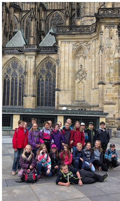
6. třída v Praze

Po skotačení na Hradě jsme se vydali Zlatou uličkou, kde byly mini domky. Po prozkoumávání jsme šli kolem chrámu sv. Víta,