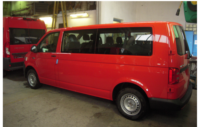
Nové hasičské auto

Díky podpoře Ministerstva vnitra ČR a Královéhradeckého kraje jsme na základě výběrového řízení mohli objednat nové hasičské vozidlo, jímž bude zcela nový devítimístný Volkswagen Transporter T6 v provedení 4x4. Výrobce už automobil dodal do firmy Hagemann Opava, která bude provádět přestavbu na hasičský vůz. Členové výjezdové jednotky provedli dne 20. 10. kontrolní prohlídku v této firmě a upřesnili požadavky a detaily dodatečné montáže některých prvků. Vozidlo nahradí už dosluhující dopravní automobil Avia A31, který je v obci od roku 1987. Nové vozidlo bude používáno i pro běžné potřeby obce, jako je přeprava důchodců na nákupy nebo přeprava občanů přilehlých obcí na divadelní představení. Slavnostní předání vozidla by mělo proběhnout v sobotu 3. prosince 2016 před hasičskou zbrojnicí v Malých Svatoňovicích.