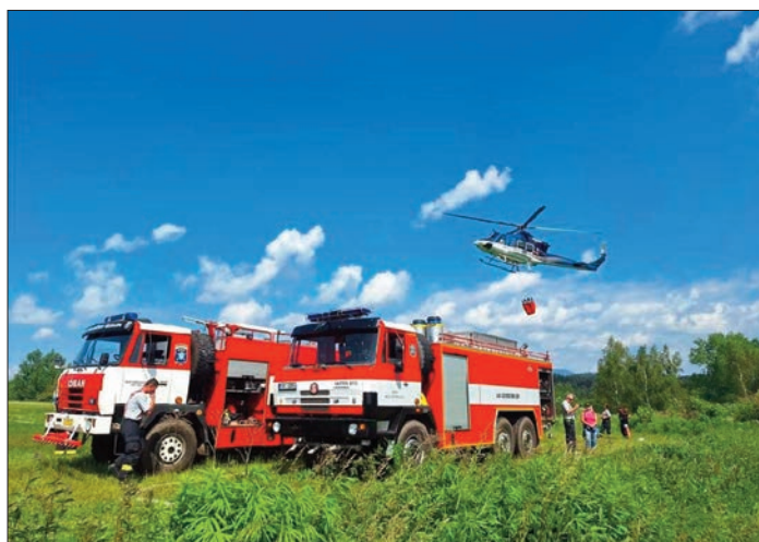
Výcvik – plnění bambi vaku vrtulníku

Vyjeli: CAS 32 – T815, DA-L2Z a spolupracovali jsme s HZS CHS Trutnov.