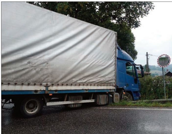
Výjezd č. 7: Dopravní nehoda – uvolnění komunikace, odtažení