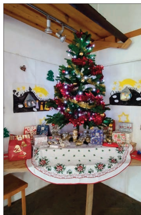
Vánoční výzdoba nesměla chybět