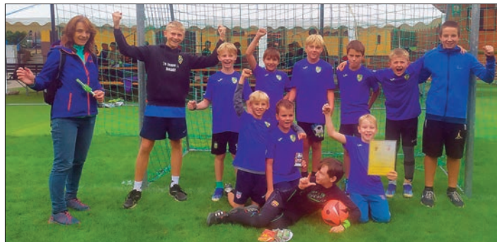
Turnaj se nám povedl