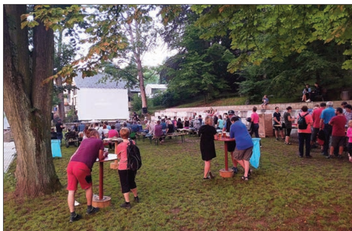
Putující biograf v Malých Svatoňovicích