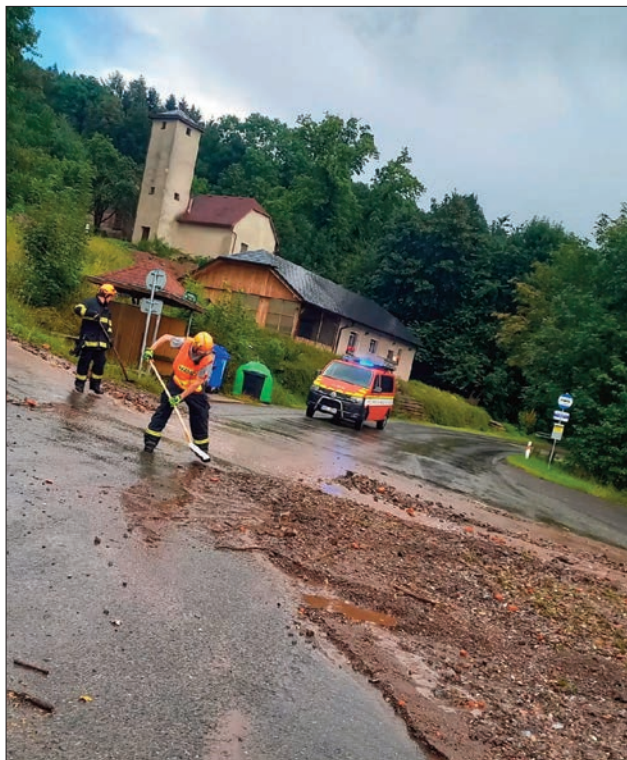
Výjezd č. 8: Technická pomoc – odstranění nebezpečných stavů

J. Müller, SDH Malé Svatoňovice fotografie archiv SDH Malé Svatoňovice