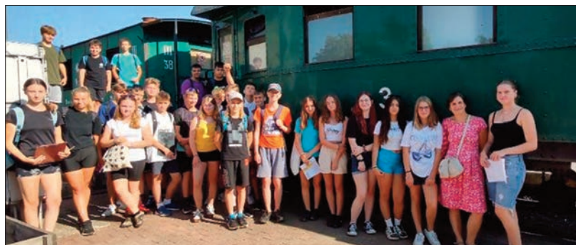
Devátáci v Legiovlaku

Přišel jako na zavanou. Tedy, přijel. Zrovna v době, kdy jsme se s devátáky měli zabývat legionáři, zakotvila tato výstava, vytvořená v replice dobového vlaku, na nádraží v Trutnově. A protože se většina žáků o prázdninách, kdy byl legiovlak i ve Svatoňovicích, nehodlala trápit historií a tuto jedinečnou výstavu si nechali ujít, vypravili jsme se první středu školního roku všichni povinně.