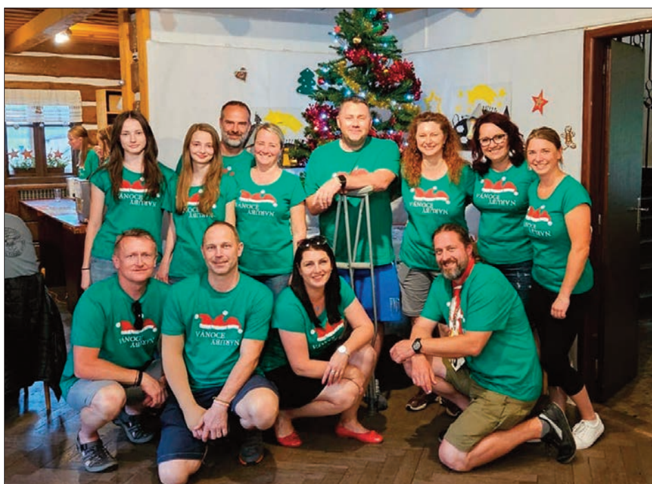
Organizátoři akce Vánoce naruby

Oslava Vánoc naruby začala společným zpěvem koled u ozdobeného stromečku na náměstí. Zábava se pak přesunula dovnitř, podávala se štedrovečerní večeře, na stolech bylo