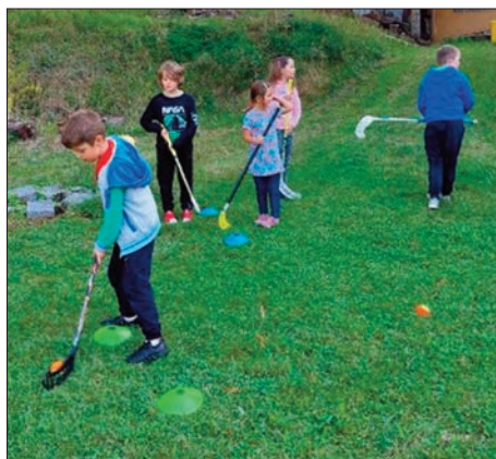
Hrajeme si venku