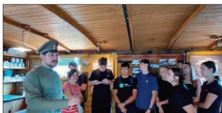
Průvodce v Legiovlaku

Vyzbrojeni pracovním listem s badatelskou otázkou „Kdo to byli legionáři?“ devátáci postupně objevovali fascinující dobrodružství rakousko-uherských zběhů, kteří nejprve bojovali za ještě nevzniklé Československo a poté se zhruba dva roky pohybovali ve vlacích po Transsibiřské magistrále, než se přes celou zeměkouli vrátili domů. Děkujeme Československé obci legionářské za zajímavě vytvořenou výstavu i za skvělé průvodcovské služby, budeme se těšit, že se k nám legiovlak zase vrátí.