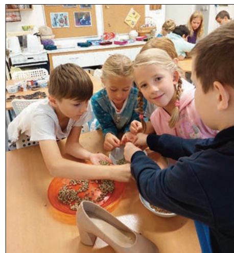
Z pohádky do pohádky