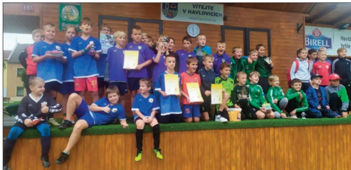
Radost z diplomu

První školní sportovní akcí okrsku Úpice se stal turnaj v minikopané, který se uskutečnil v Havlovicích. Naši chlapci porazili Lány i Blahovku a ve vyrovnaném utkání podlehlí Rtyni 0:1. Celkově se umístili na výborném 2. místě!