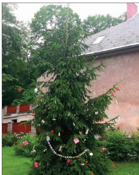
Ozdobený stromek na náměstí