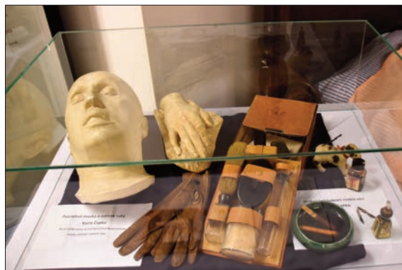
Vystavené sbírkové předměty z depozitáře

Přes letní měsíce muzeum a infocentrum patřily především individuální turistice. Tito turisté ocenili náš výjimečný exponát i doprovodné sbírkové předměty z depozitáře, které běžně k vidění v expozicích nejsou. Takovéto zpestření jinak stálých expozic přináší oživení do celé prohlídky a větší zájem o osobnost a dílo Karla a Josefa Čapkových. Proto budeme s vystavováním sbírkových předmětů z depozitáře rozhodně i nadále pokračovat.