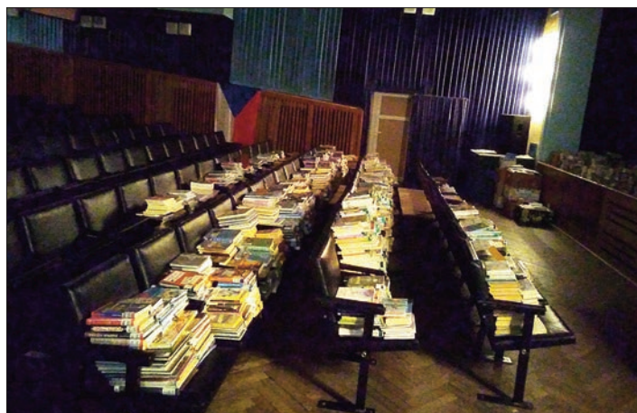
Uložení knih v době úprav knihovny