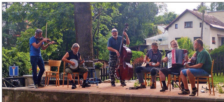
Skupina KUCMOCH otevřela Amfík u Studánky