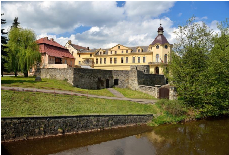
Muzeum Boženy Němcové v České Skalici