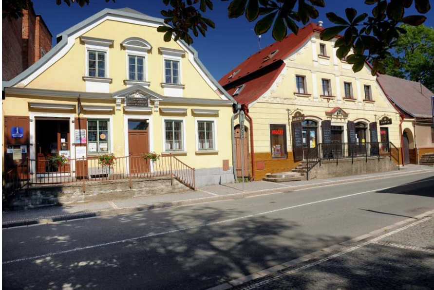
Domek Boženy Němcové v Červeném Kostelci