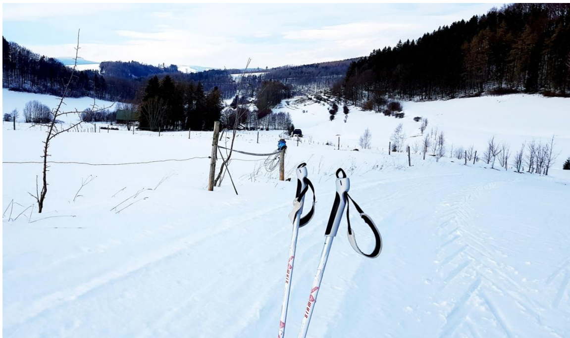
Zima v Kladském pomezí