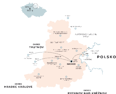
archiv KIS Hronov