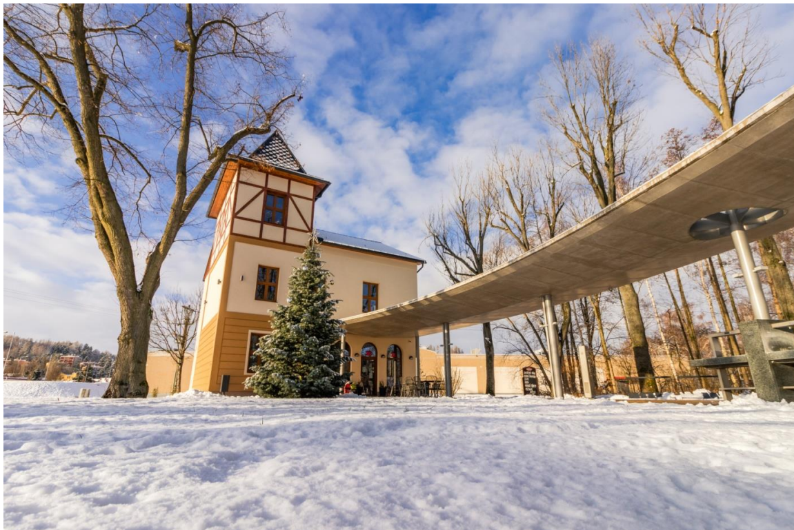
Malé lázně Běloves