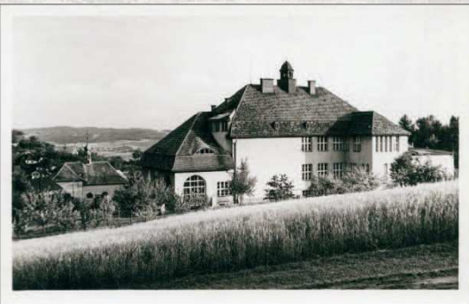
Budova obecné a měštanské třířádkovy školy (dostavěná v roce 1923)