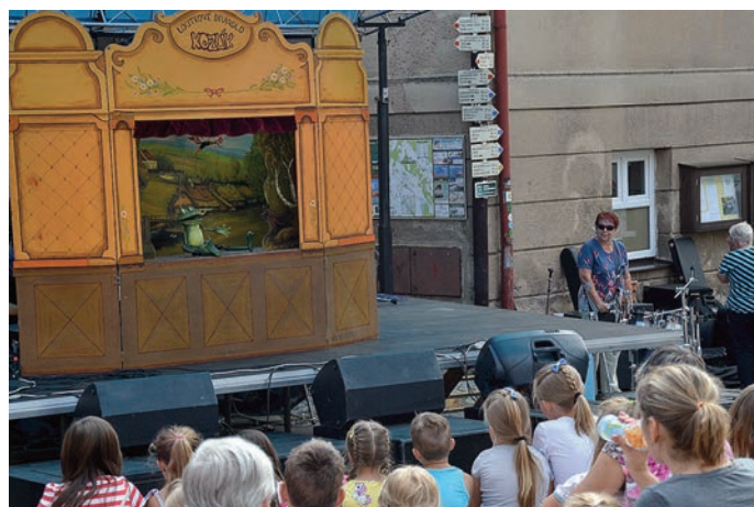
Vodnická pohádka při akci Léto nekončí

Pak už náměstí patřilo převážně hudbě. Jako první vystoupila bigbítová kapela Pegas, která v okolí vystupovala na vyhlášených tancovačkách už od roku 1978. Staronové vystoupení předvedla skupina RITMO FACTORY, která rozezněla náměstí již v loňském roce. Pro letošní ročník si ale členové skupiny dali za cíl rozehrát a rozbubnovat všechny zúčastněné, a povedlo se! Odvážných bylo mezi návštěvníky akce dostatek, a tak se zrodila největší bubenická show v Malých Svatoňovicích. 😊