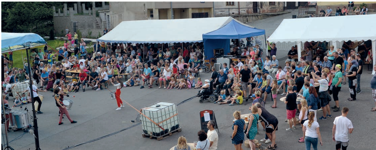
Náměstí se zaplnilo dokonale