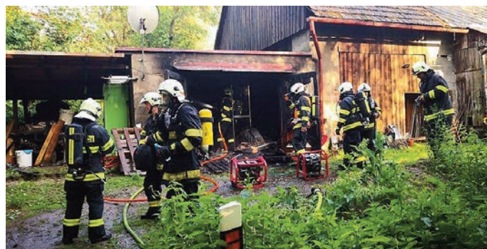
Požár garáže Strážkovice