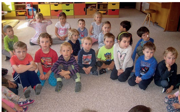
Děti z MŠ Malé Svatoňovice

Přes prázdninové volno jsme se snažili ve školce něco opravit, vyměnit a vymalovat, aby se dětem u nás líbilo. I v letošním roce se mohou těšit na pravidelné návštěvy loutkového divadla ve Rtyni v Podkrkonoší, na předplavecký výcvik v krytém bazénu v Trutnově nebo na zimní lyžařskou školu. A čekají nás i společné oslavy, akce pro rodiče a děti, pracovní dílničky v mateřské škole a spousta dalších dobrodružství, která se postupně objeví.