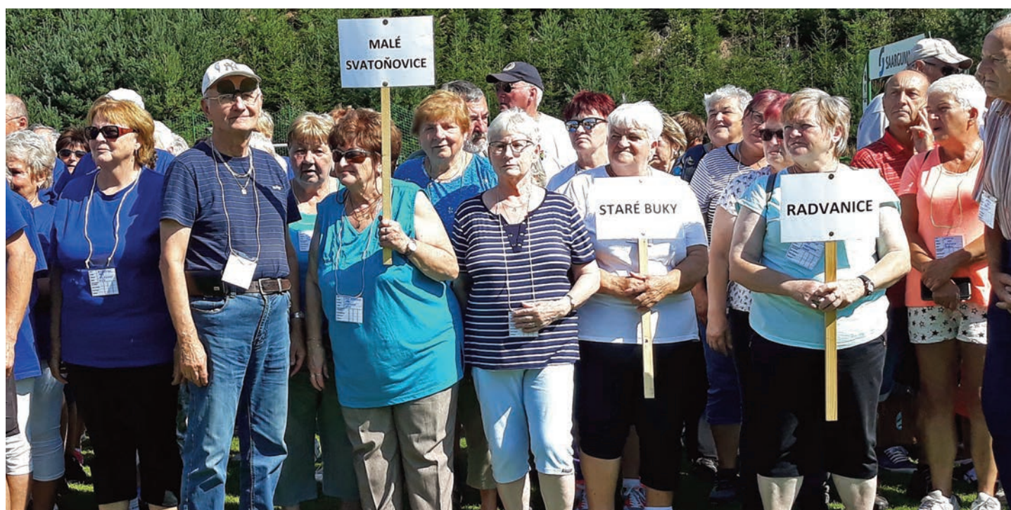
Účast na olympiádě pro starší a dříve narozené v Havlovicích