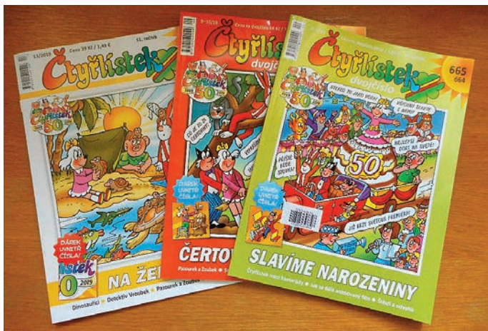
Čtyřlístek slaví 50 let