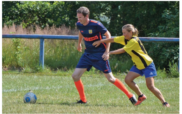
Ženy se nebály

Zápas byl napínavý od samého začátku, o domluveném výsledku nebyla žádná řeč a bylo to znát i na hře, nikdo nikomu nic nedaroval. Ohledy se nebraly ani na zmíněné dámy, které ale ukázaly, že fotbal není jen pro chlapy.