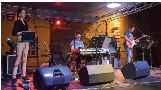
Zábava pokračovala se skupinou Taurus