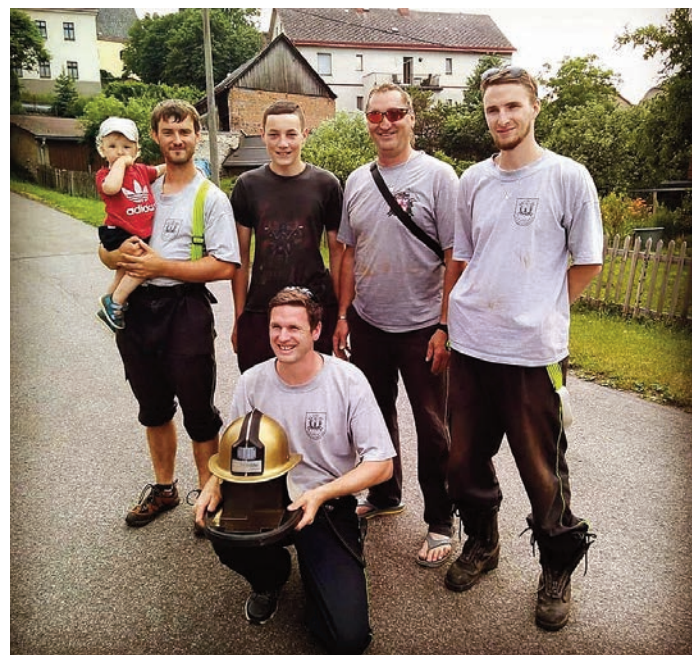
Vítězné družstvo Zlatá přilba

Období letošního června až září bylo pro nás opravdu velice pestré. Podíleli jsme se na přípravě obecních akcí jako Léto nekončí a na letních kinech. Dále jsme se zúčastnili hasičských závodů a měli různé hasičské výcviky. Časově nejnáročnější ovšem bylo připravit se na rekonstrukci hasičské zbrojnice. Čekalo nás kompletní vyklízení zbrojnice a přilehlých částí hasičárny. V rámci menších ale i větších brigád jsme stále vyklízeli. Den „D“ nastal 9. srpna 2019, kdy byly z hasičské zbrojnice vyklizeny poslední věci, a výjezdová technika byla přesunuta za obecní úřad, kde zůstane po dobu rekonstrukce. V pondělí 12. srpna 2019 jsme předali klíče stavební firmě, která zahájila samotnou rekonstrukci. Všem, kteří se účastnili brigád a pomohli při vystěhování, děkujeme!