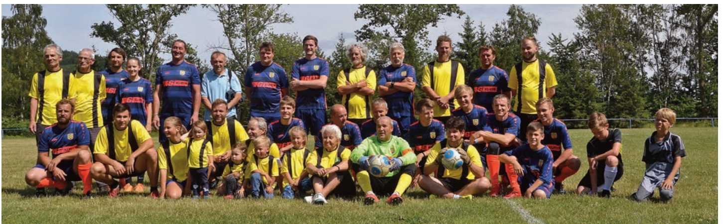
Společné foto obou týmů