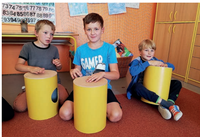
Z projektového dne

Svůj první den ve škole zahájili prvňáčci slavnostně v obřadní síni. Ve škole je pak 5. září čekal i jejich první projektový den, při kterém měli příležitost poznat celou budovu prvního stupně a seznámit se se svými