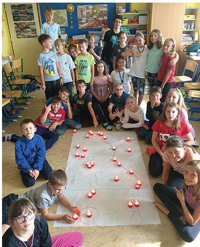
Z adaptačního programu 5. třídy

Ve dnech 10. 9. až 11. 9. 2019 proběhl v páté třídě adaptační program ve spolupráci s PPP Trutnov. Do této třídy přibylo 9 nových žáků, a tak byl zaměřen na vzájemné poznání žáků i nové třídní učitelky. Po oba dva dny byly děti vedeny k různým aktivitám (komu-