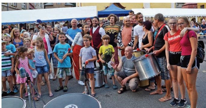
Společné foto svatoňovických bubeníků

Po bubenickém rozjezdu se z pódia valila další vlna energie od kapely Benjaming's Clan, která roztančila celé náměstí. Pokračování v rytmu zábavy zajistila kapela Taurus, která hrála a zpívala až do pozdních nočních hodin. Chtěli bychom poděkovat všem, kdo jste přišli a užili si odpoledne, a všem kdo se podílel na přípravách a organizaci akce. Těšíme se na další setkání.