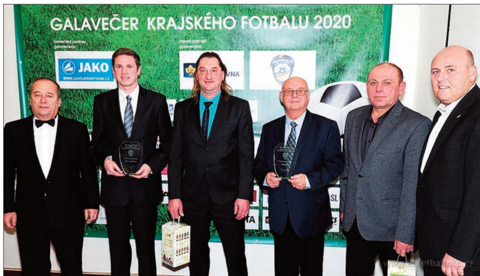
10. ročník Galavečera KFS – fotbalová obec roku

Oddíl kopané TJ Sokol Malé Svatoňovice, potažmo celá obec si cenu opravdu zaslouží. V takovém počtu obyvatel jaký máme, je obdivuhodné naplnit a udržet tři mládežnické týmy a jeden tým mužů, aniž by se musely slučovat do soutěží s jinými týmy z jiných klubů. Vám všem patří velké poděkování a velká poklona před tím, kolik volného času fotbalu a další organizaci věnujete. Samotná obec má na podpoře oddílu kopané také podíl, a to primárně finanční. Za dotaci 30 000 Kč byl