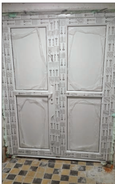
Dotované nové dveře