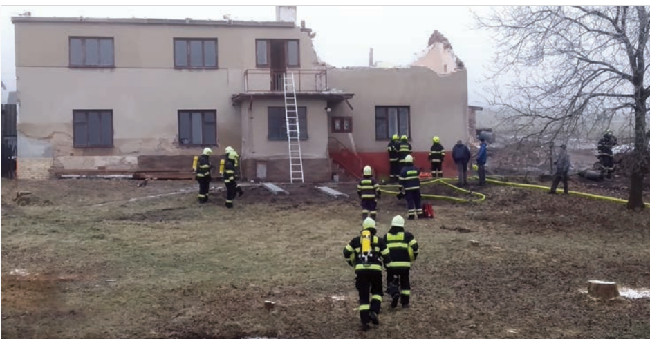
Prověřovací cvičení při požáru rodinného domu