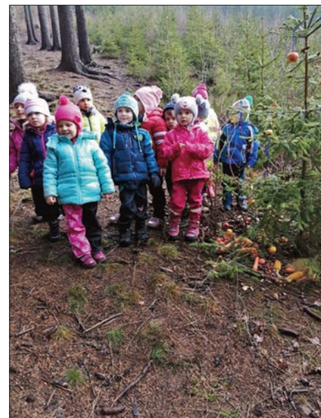
Děti myslí také na zvířátka

A co nás čeká v únoru? Hned zkraje měsíce zavítáme opět do divadla, tentokrát se budeme těšit na pohádku Bouda, budka. Starší děti se zúčastní v týdnu od 17. do 21. 2. lyžařského výcviku v lyžařském areálu Bret v Žacléři. Proběhne též 2. lekce projektu Dětský úsměv a pak již vykoučíme vesele do jara.