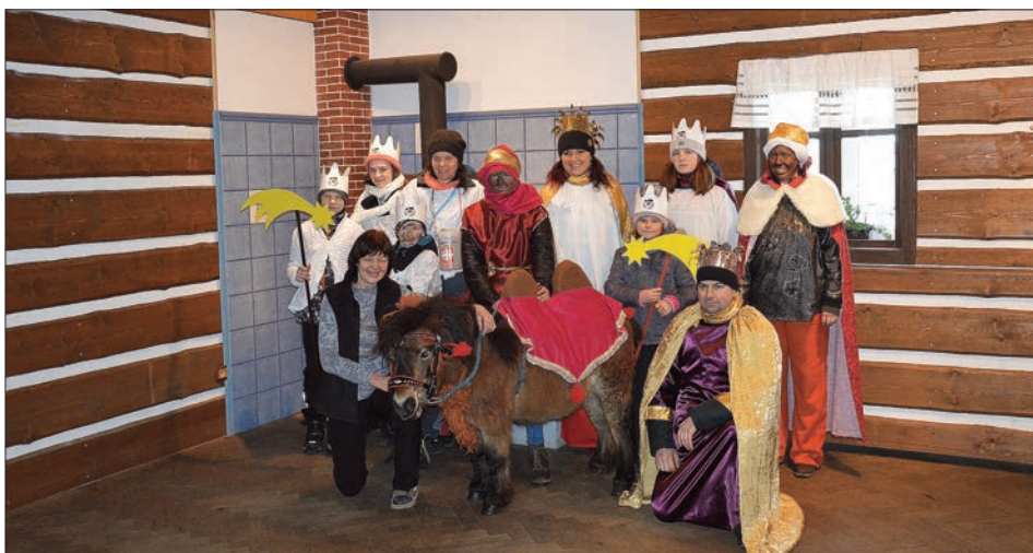
Tříkrálová sbírka i s velbloudem