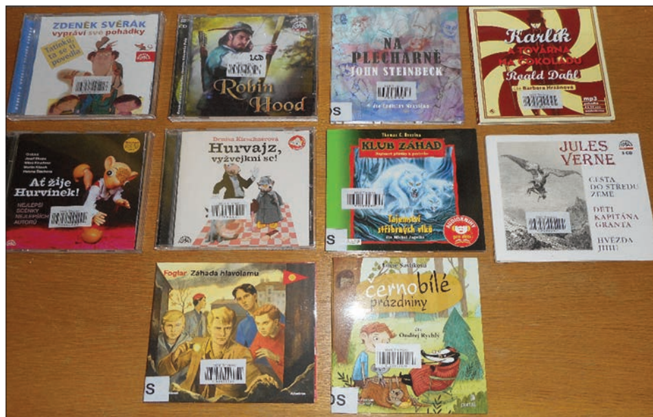
Audioknihy pro děti