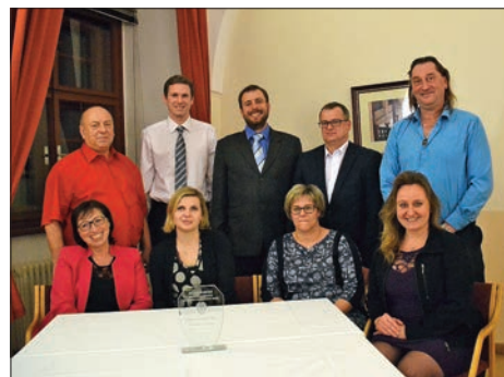
Ocenění Fotbalové obce roku 2019

Hejtman Královéhradeckého kraje, pan Jiří Štěpán, který se vyhlášení osobně zúčastnil, se pochvalně vyjádřil o všech, kteří se fotbalu věnují. Reportérům z Deníku řekl: „Poděkování všem lidem, kteří se kolem amatérského fotbalu pohybují, je nezbytné. Kromě trenérů a hráčů je třeba ocenit hlavně ty osobnosti, na které není úplně vidět, a při-