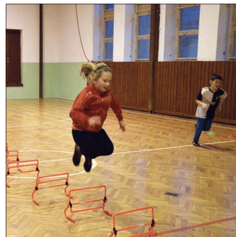
Trénink v tělocvičně

a další fotbalové dovednosti. Připravují fotbalovou taktiku, postavení na hřišti a zvyšují svou tělesnou zátěž a vytrvalost.