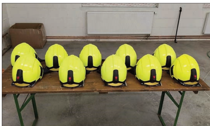
Nové přilby pro výjezdovou jednotku SDH