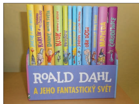
Box knížek R. Dahl k vypůjčení