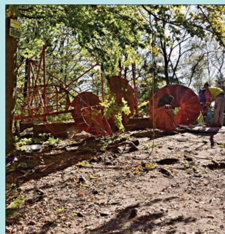
Plánovaná demolice rozhledny autor Stanislav Krčmář