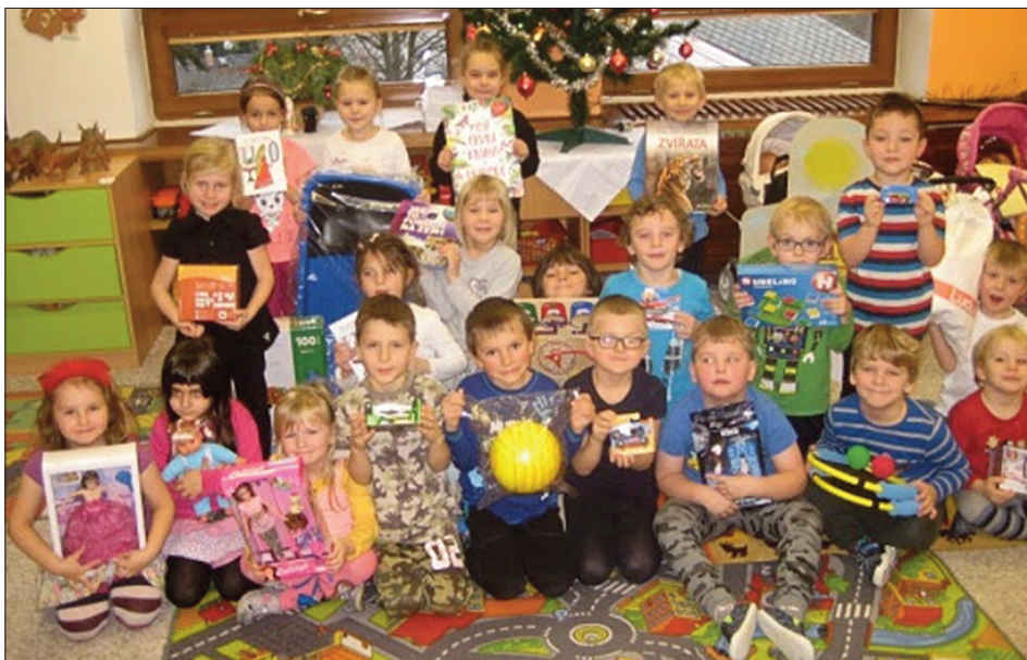
Ježíšek na děti ve školce nezapomněl

Po vánočních prázdninách jsme se opět sešli 6. ledna a hned 8. ledna nás čekalo zhlédnutí filmu Korálový útes ve speciálním sférickém kině, které zavítalo přímo k nám do školky. Promítalo se v obrovském nafukovacím stanu, kde děti ležely na karimatkách a „moře“ bylo všude kolem nich. I přes počáteční nedůvěru zvláště malých dětí se pohádka všem moc líbila.