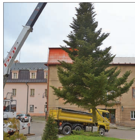
Příprava vánočního stromu