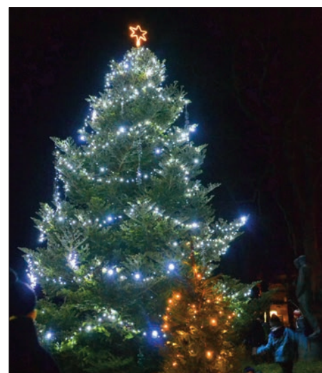
Fotogalerie z programu Advent u Studánky