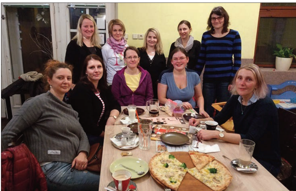
Výroční schůze RC Žaltmánek

V pondělí 27. ledna 2020 se konala výroční schůze spolku, které se zúčastnila i řada nových členek, což nás velmi potěšilo. RC Žaltmánek jako každoročně uspořádá několik akcí pro děti. V červnu to bude dětská trasa pochodu Krvavej Čepelka, na podzim Drakiáda na Klůčku a v prosinci Čertovský rej. Velkou novinkou je to, že po deseti letech se organizace některých akcí přesune od „zasloužilých“ členek RC Žaltmánek na nové maminky. Těšíme se