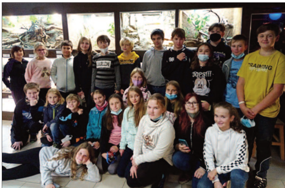
Žáci 6. třídy při návštěvě přírodovědného centra v Hradci Králové

Výlet se nám moc líbil, rádi na něj vzpomínáme. (Terka)