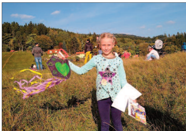
Děti si drakiádu užily