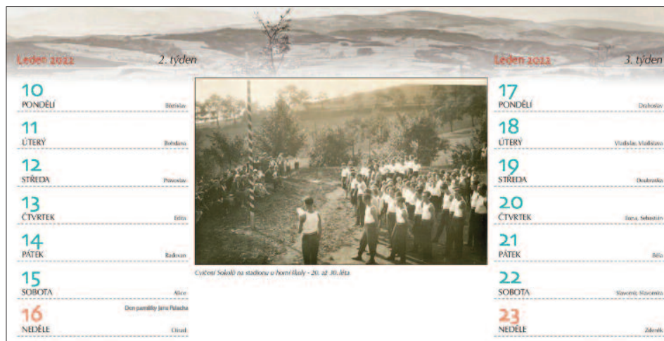
Ukázka z kalendáře pro rok 2022