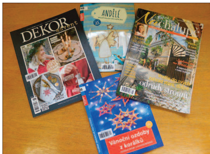
Kreativní časopisy a sešity, autor Hana Kozúbková