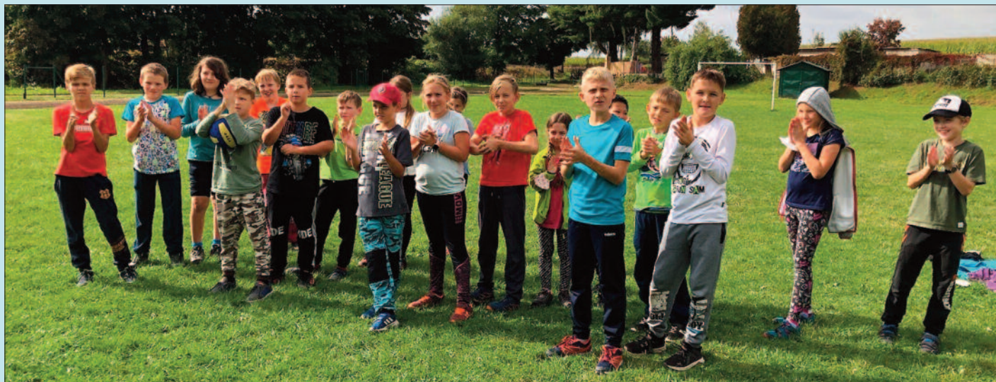
Adaptační program přináší vzájemné poznání žáků i nové třídní učitelky, autor Eva Brátová