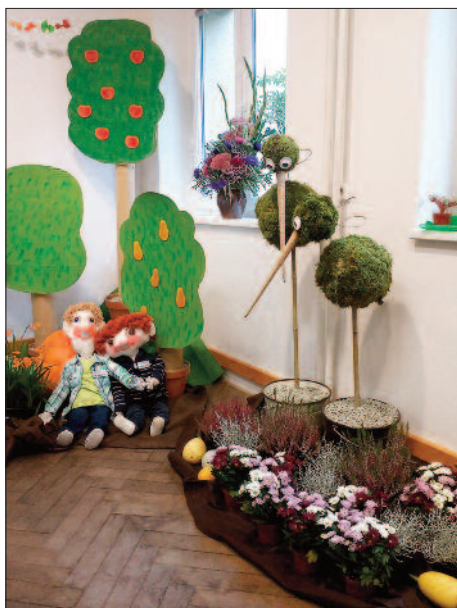
Zahrádkářská výstava a její dekorace