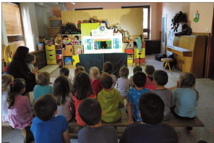
Divadlo ve školce