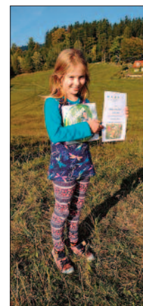
Nejvytrvalejší letkyně letošní drakiády,