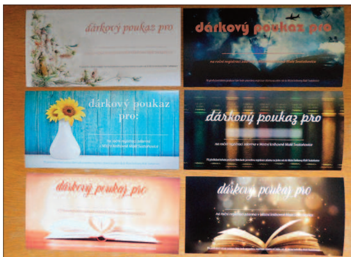
Dárkové poukazy, autor Hana Kozúbková