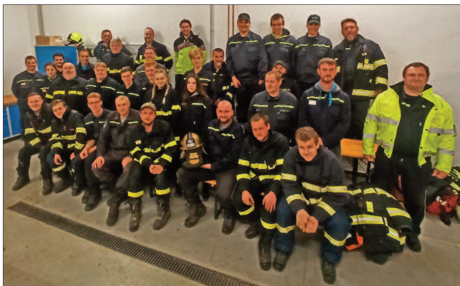
Aktéři soutěže O zlatou přilbu, autor archiv SDH Malé Svatoňovice

V pátek 15. 10. jsme u naší hasičské zbrojnice v Malých Svatoňovicích pořádali soutěž O zlatou přilbu. Bojovalo se v pěti disciplínách. První disciplínou bylo sání. Čtyři soutěžící museli spojit savice s košem, pak připojit savice na stroj a uvázat lana. Další na řadě byla štafeta dvojic, kdy velitel vybíhal na označenou metu, následně první dvojice obíhala velitele a musela překonat překážku v podobě prolezení osobního automobilu a smotat hadici s proudnicí. Následně druhá dvojice tuto hadici opět roztáhla, prolezla automobilem a běžela do cíle. Po proběhnutí vybíhal velitel zpět. Jako třetí disciplína byl připraven kuželník. V časovém limitu se soutěžící snažili trefit požární hadicí co nejvíce kuželek. Čtvrtou disciplínou byla soutěž s názvem Džbery. Jednalo se o sestřelení plechovek na čas za pomoci džberových stříkaček. Jako poslední soutěž byla připravena štafeta. Zde se plnilo například spojování hadic, přeskok překážky, spojování žebříku, převalování pneumatiky, přenos hasičského přístroje atd. Po sečtení všech výsledků se na prvním místě umístil sbor dobrovolných hasičů z Velkých Svatoňovic. Gratulujeme! Poděkování ovšem patří všem zúčastněným sborům, a to SDH