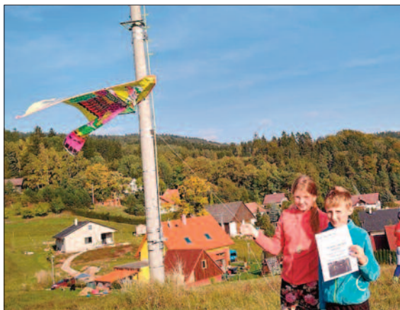
Vítězové letošní Drakiády