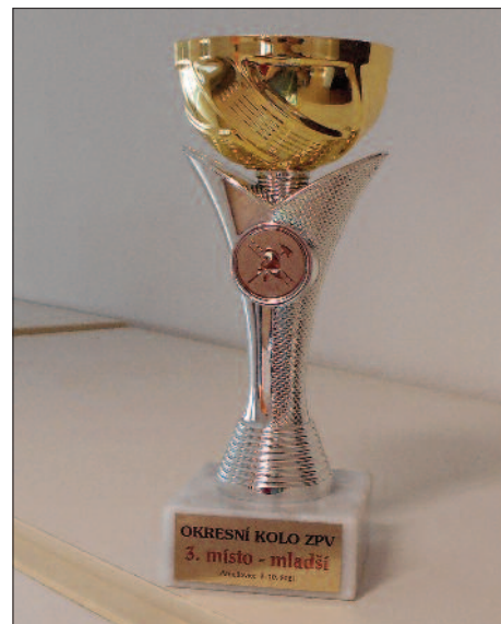
Získaný pohár pro mladší hlídku

Bližší informace o kroužku: Ivana Vosyková, mob.: 602 489 218