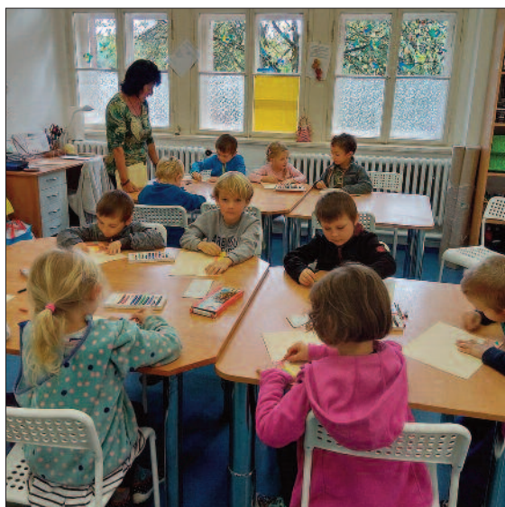
Děti ze školky na návštěvě ZŠ