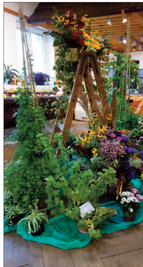
Květinové zátiší z výstavy, autor Monika Killarová