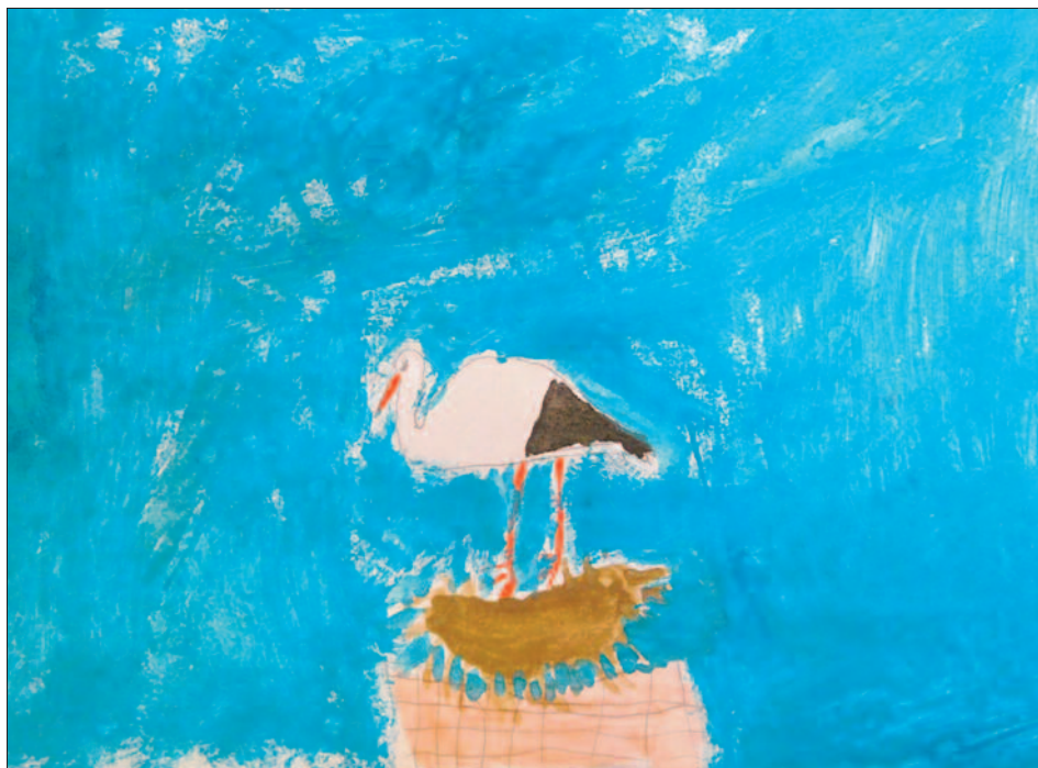
Obrázek od čtenáře B. Beneše II. třída ZŠ

Nově odebíráme časopis Na chalupě s Terezou Bebarovou. Měsíčník je určen všem čtenářům, kteří se zajímají o stylový život ve venkovských chalupách, staveních a chatách. Časopisem provází herečka Tereza Bebarová, sama velká milovnice venkova a ctitelka starých tradic a řemesel, a nabízí čtenářům inspirativní návštěvy zástupců mnoha oborů, kutilů, výrobců či umělců. V časopise nechybí stránky se stylovým designem pro venkovská obydlí, technická a zahrádkářská témata, stránky o cestování a nejrůznější rady a tipy odborníků. Na sto stranách pak našla prostor i sezónní témata a samozřejmě nechybí ani lá-