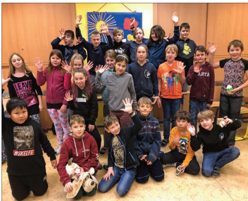
Pátá třída pospolu, autor Eva Brátová