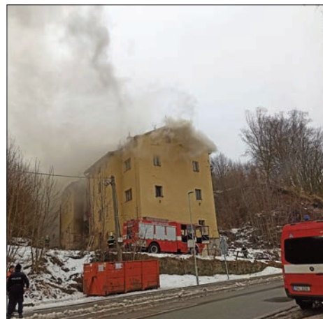
Požár v Úpici

30. ledna v 11:40 vyjela jednotka do ul. Regnerova v Úpici k požáru neobydleného bytového domu. Požár zasáhl podkroví objektu. Spolupráce s HZS PS Trutnov, SDH Havlovice, SDH Batňovice, SDH Úpice a PČR Úpice. Výjezd CAS32-T815 a DA-L2Z.