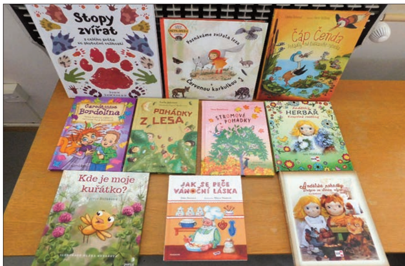
Nové dětské knihy