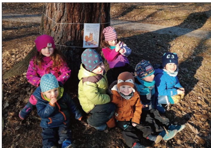
Z akce Zásoby veverky Zrzečky