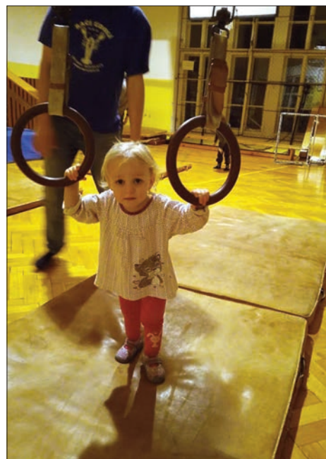
Cvičení s dětmi ve školní tělocvičně