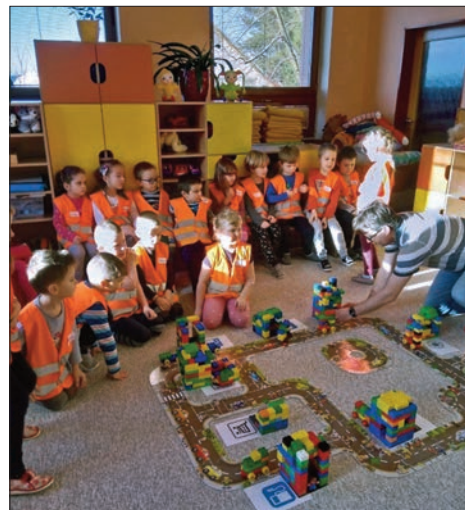
Projekt MŠ: Stavitel města, autor archiv MŠ