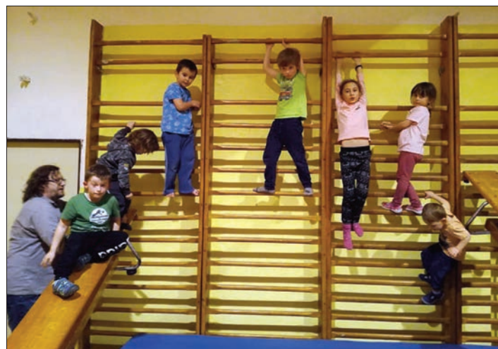
Cvičení je různorodé