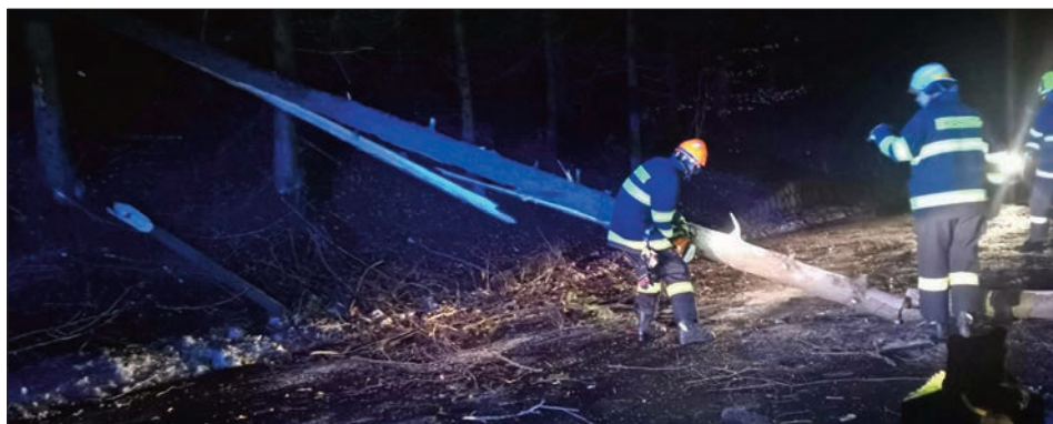
Popadané stromy Odolov

7. února vyjížděla jednotka v 6:39 na odstranění stromu, který spadl přes hlavní komunikaci v Odolově. Komu-