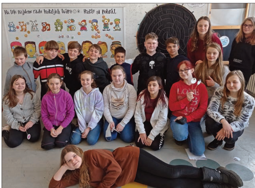
Žáci při návštěvě muzea