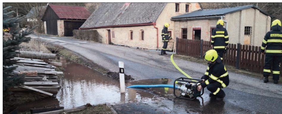
Čerpání vody ve Strážkovicích

19. února po výjezdu č. 7 jsme následně vysláni na odstranění spadlých stromů z komunikace v Odolově. Výjezd DA-L2Z.