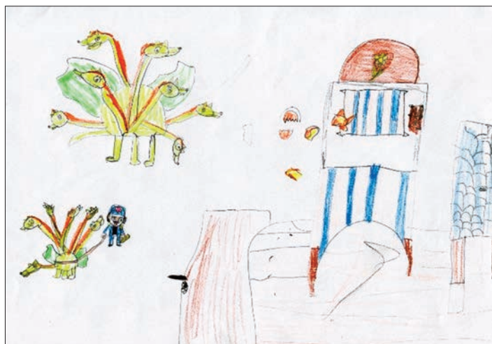
Obrázek z edukačních programů pro 1. stupeň ZŠ