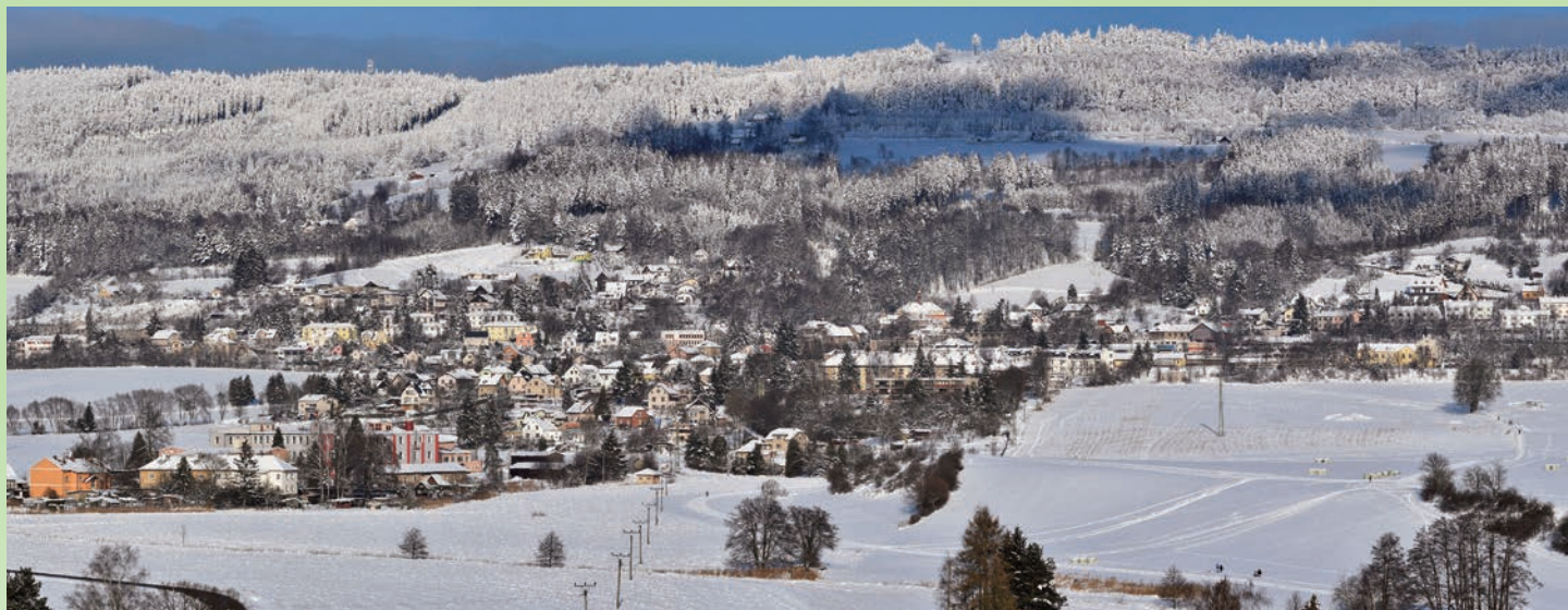
Malé Svatoňovice s dominantou rozhledny Žaltman