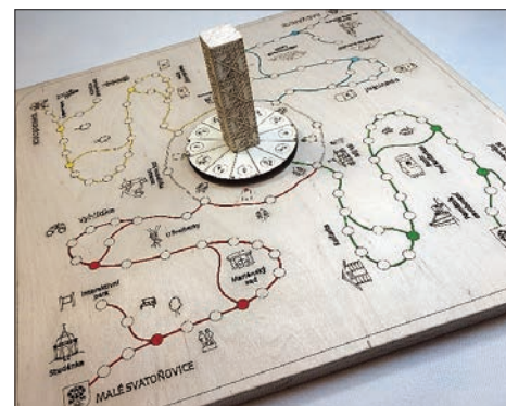
Foto hry Vejšlap na Žaltman