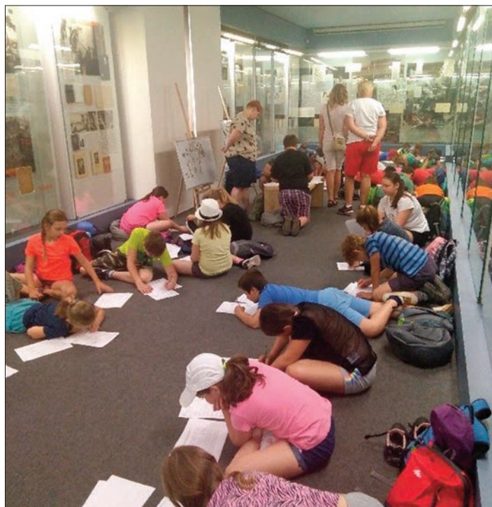
Edukační program pro školy