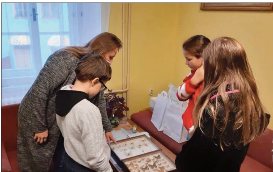
Na památku od nejmenších návštěvníků