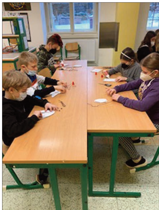
Z průběhu projektu na zdravotní škole v Trutnově