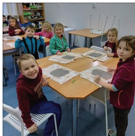
Výtvarné dílny ve spolupráci s ZŠ