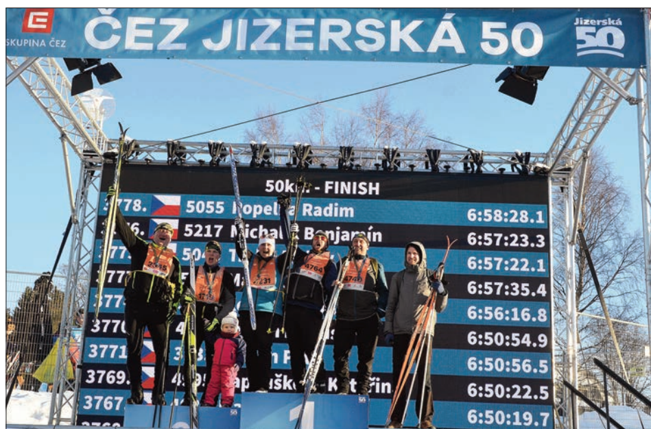
Účastníci Jizerské padesátky