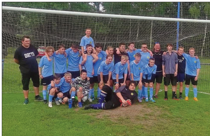
Tým starších žáků za sezonu 2022/2023