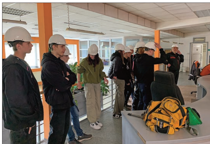
Z velínu elektrárny