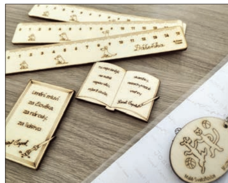
Nové tematické suvenýry v muzeu