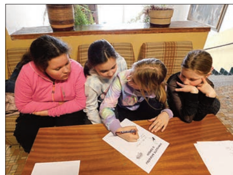
4. třída – skládání básničky

Při druhé besedě s druháčky jsme nemuseli chodit daleko, byla věnována dětství sourozenců Čapkových. Děti se dozvěděly, kde a jak trávili své mládí Helena, Josef a Karel, jaké měli koníčky, co se učili, uměli atd. Prohlédli jsme si dobové fotografie, různá vydání Dášanky, děti mohly skládat puzzle s pejskem a kočičkou, hledat rozdíly na obrázcích, přiřazovat správné názvy k obrázkům z pohádek. V knize Jana Skácela „Kam odešly laně“ jsme si přečetli básničky a následně se děti mohly seznámit s ilustracemi Josefa Čapka, které knihu doplňují. Poznaly tak vý-