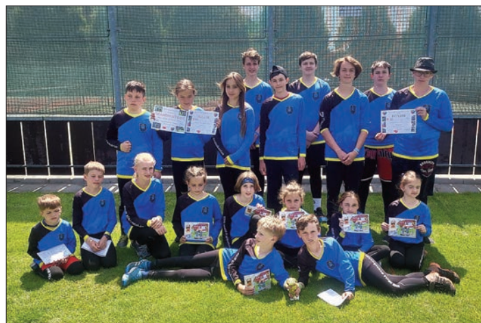
Ze soutěže Okresního kola Plamen Havlovice

kolektiv vedoucích mládeže SDH Malé Svatoňovice