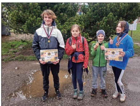
Z dětské soutěže „Železný hasič“