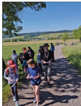
Z pochodu Krvavej Čepelka