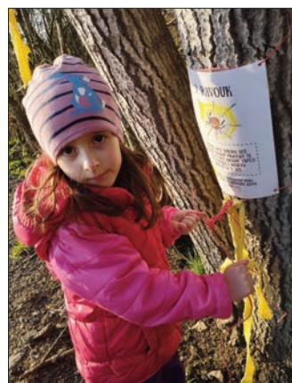
Stezka Probouzení jara