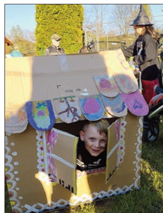
Soutěž z pálení čarodějnic