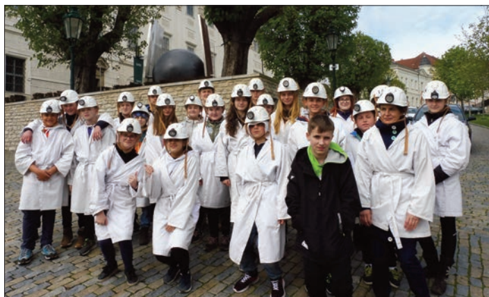
Vybavení na prohlídku do stříbrného dolu

V Kutné Hoře jsme navštívili Chrám svaté Barbory. Byla tam spousta soch svatých a hodně oltářů. Také jsme tam viděli obrovské varhany a různá výtvarná díla. Bylo to tam moc hezké. Šli jsme se také podívat do místní štol, kde jsme byli v hloubce 35 metrů. Šli jsme asi po 160 schodech do podzemí. Ve štolě to bylo úzké a nízké, nedá se ani spočítat, kolikrát jsme se bouchli do hlavy. Průvodce nám taky předvedl, jak vypadá absolutní tma, a viděli jsme světlo, pod kterým pracovali havíři.