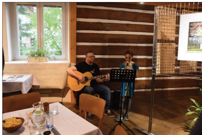
Hudební doprovod při vernisáži autor fotografií Hana Kozúbková