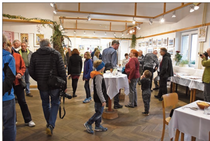
Z průběhu vernisáže výstavy

Děkujeme za skvělou spolupráci všem třem autorům foto-