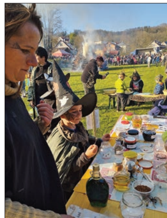
Žaltmánek - čarodějnice