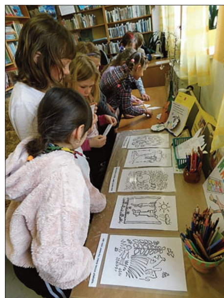
2. třída – lámeme si hlavičky