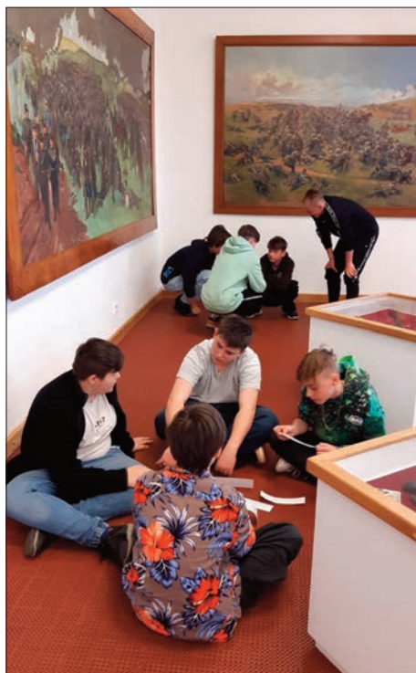
Učíme se o Trutnovské zradě

Většina z nás ale už od vlaku myslela hlavně na rozchod, který následoval. Někteří šli na kebab, jiní třeba na pizzu nebo kamkoli jinam. Když jsme se opět všichni sešli na náměstí, přišel k nám ještě pan průvodce a velmi dlouho nám povídal zajímavosti o Trutnovské zradě. Když jeho proslov skončil, vzal nás ještě do Jánské kaple, kterou jsme si mohli prohlédnout