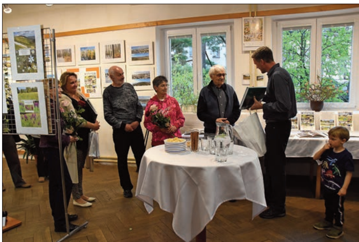
Poděkování autorům fotografií