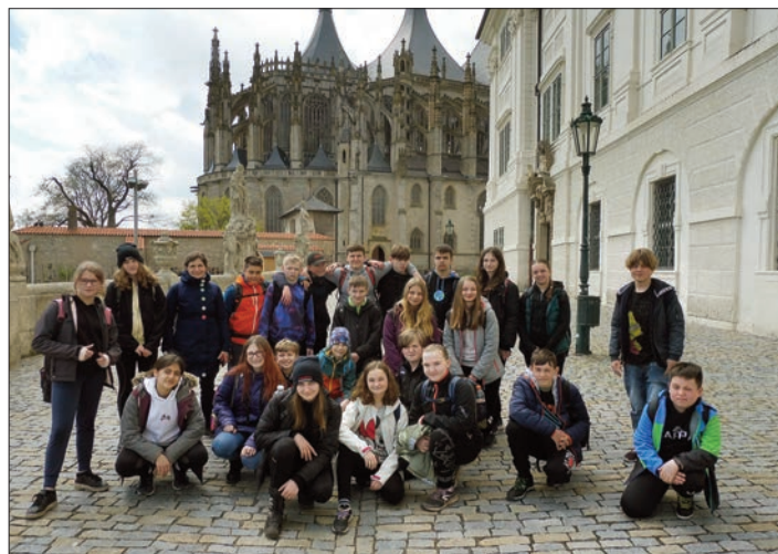
Sedmáci u Chrámu sv. Barbory