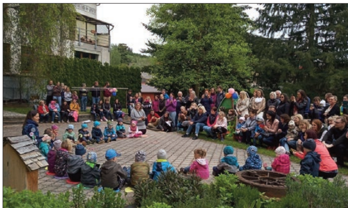
Zahradní slavnost ke Dni matek