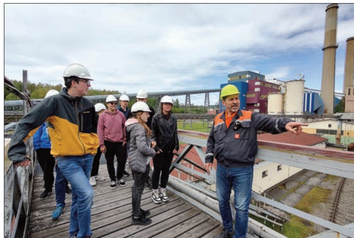
Při prohlídce elektrárny