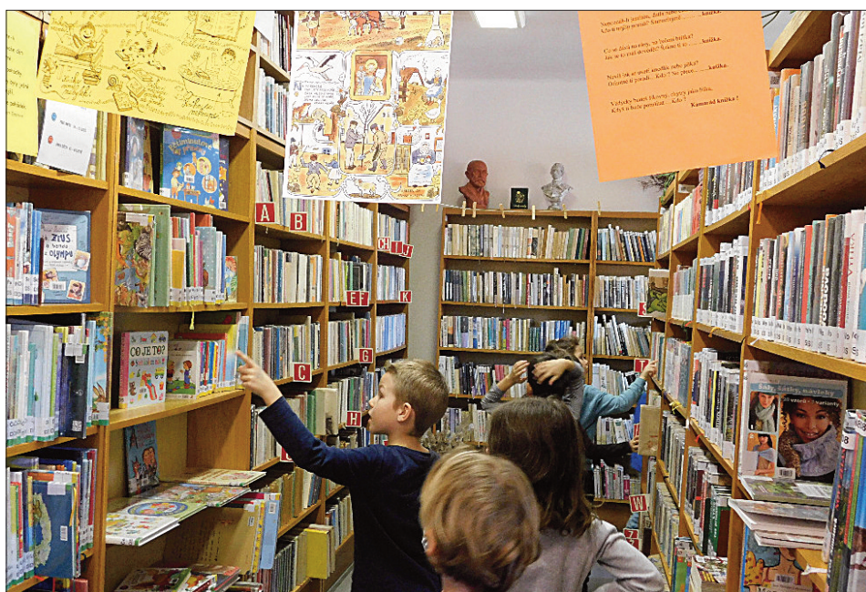
Seznámení s knihovnou

tvrný směr kubismus a jak se dá jednoduše z geometrických tvarů nakreslit obrázek.