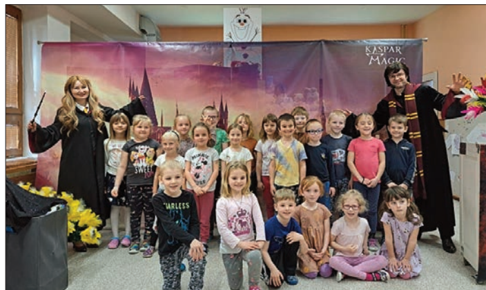
Kouzelný Harry Potter