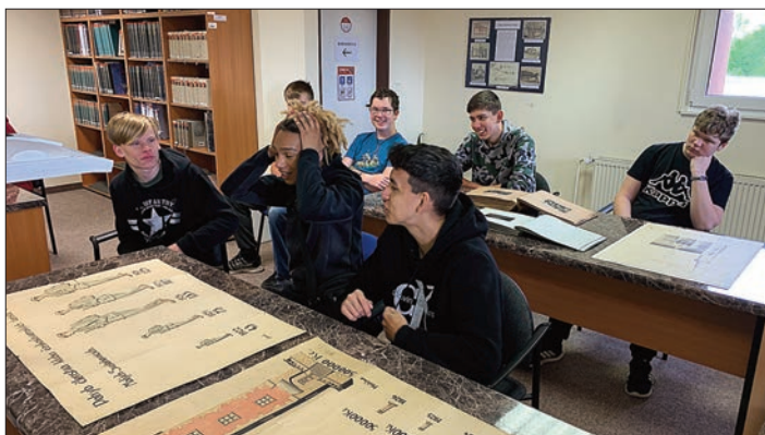
Ze Státního okresního archivu

Žáci 9. třídy měli ve čtvrtek 18. 5. velmi rušný den. Nejprve navštívili Státní okresní archiv, kde zasedli k badatelským stolkům a měli možnost prohlédnout si spoustu připravených archiválií, např. Kroniky Malých Svatoňovic, třídní výkaz Karla Čapka. Také se dozvěděli, podle koho se jmenuje vrch Žaltman. Prošli si depozitář, kam nemají běžní návštěvníci přístup, aby věděli, kde se veškeré archiválie skladují.