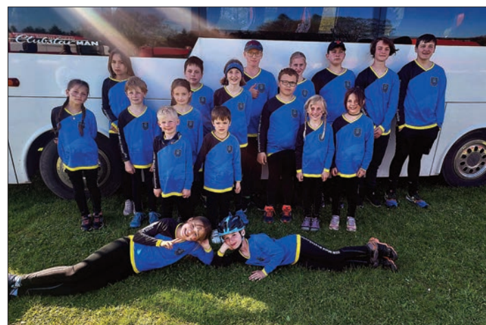
Mladí hasiči na Vlčické 60