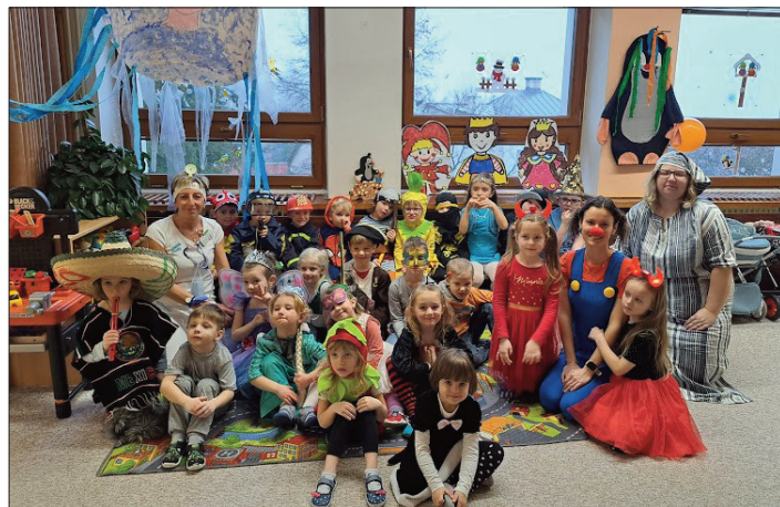
Karneval ve školce

A už tu máme květen a ani s ním nám zatím to krásné slunečné počasí nepřichází. My jsme se ale nenechali odradit a uspořádali zahradní slavnost ke Dni matek, kde děti ukázaly svá krásná vystoupení, zasoutěžily si a odnesly si malé