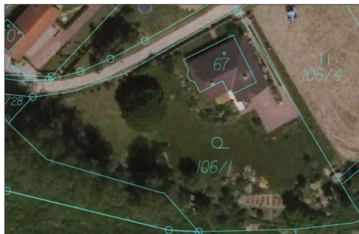
Sloučení parcel po revizi