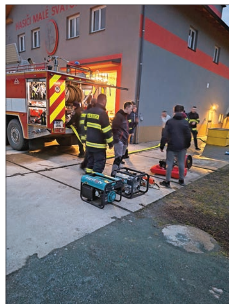
Školení na věcné prostředky, kterými disponuje naše jednotka