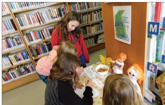
3. třída hádání pohádek podle předmětů

Třetí třídu čekala knihovna plná hádanek, kvízů a doplňovaček. Děti skládaly slova, pořekadla, komiksy, básničku,