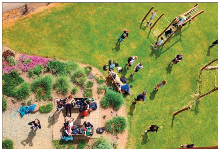
8. třída v Žernově z výšky