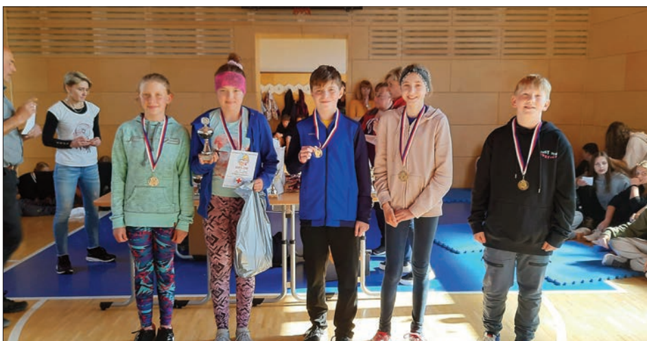
Hlídka mladších žáků 1. a 2. místo