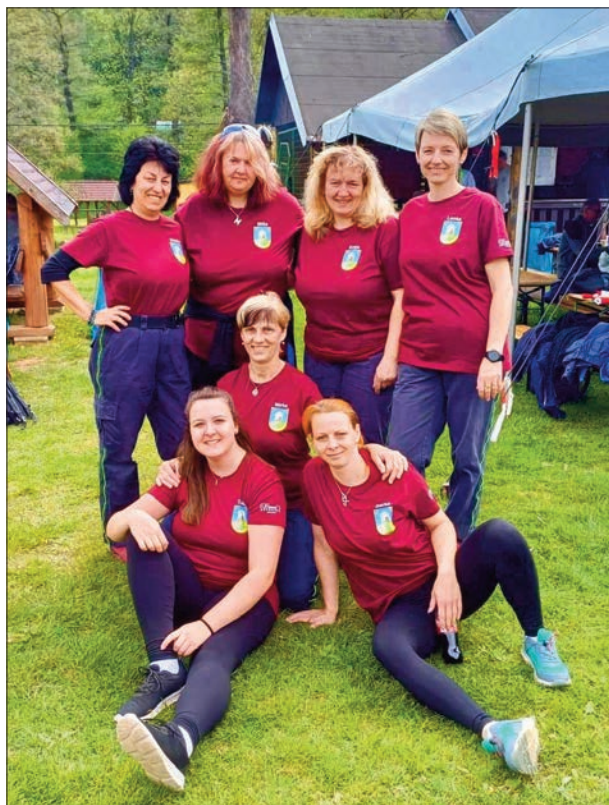
Hasičky Petrovice s navrhovaným erbem