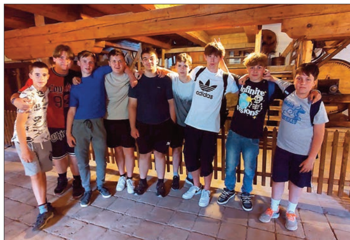
Kluci ve mlýně