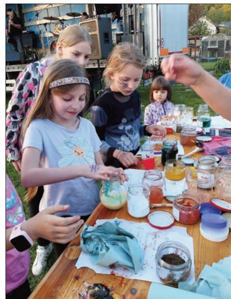
Soutěže na čarodějnicích