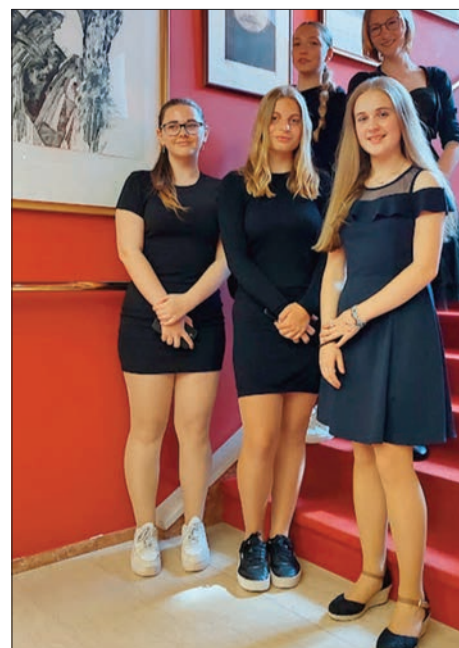
A takhle nám to v divadle sluší