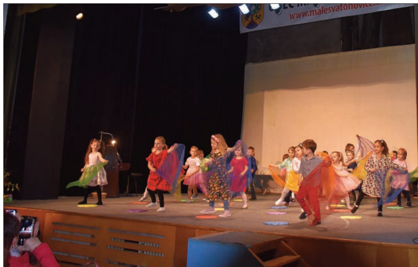
Vystoupení MS při zahájení velikonoční výstavy

V. Jiránková Odrobiňáková, kulturní odbor obce