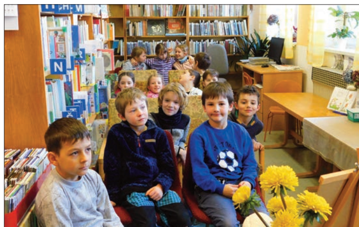
2. třída dětství sourozenců Čapkových

hádaly ilustrátora, jeho hlavního hrdinu, podle předmětů měly uhodnout pohádky. Na začátku dostaly obrázek postavy, při splnění každého úkolu dokreslovaly postavě různé části oblečení, např. klobouk, halenu, kalhoty, vysoké boty, plášť, hůl aj. Na konci musely uhodnout, o kterou pohádkovou bytost se jedná. Tentokrát to byla postava Krakonoše. Žáci si vedli velice dobře.