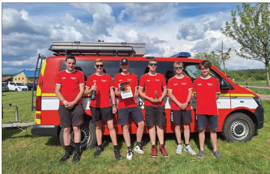
2. místo v požárním útoku