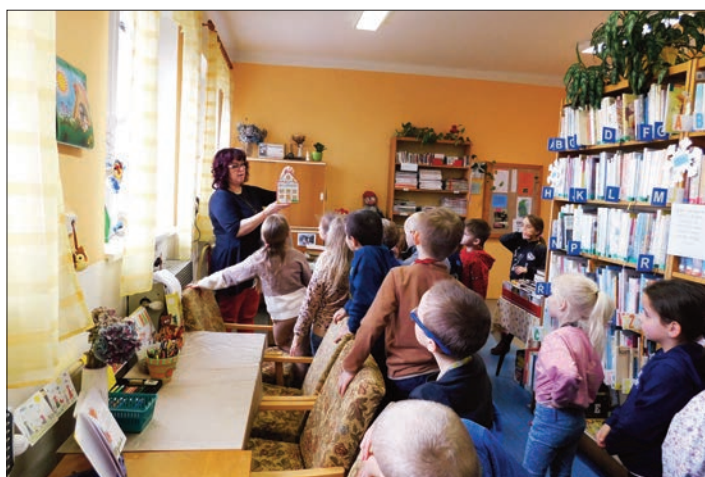
Beseda s 1. třídou

Došlo k výměně doplňkového souboru knih.