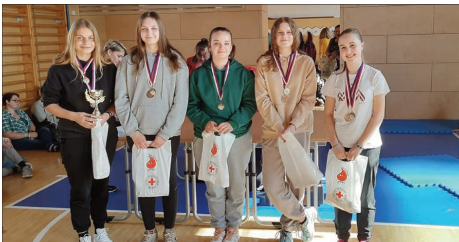
Hlídka starších žáků 3. a 1. místo