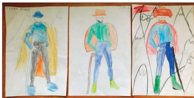
3. třída výsledné obrázky