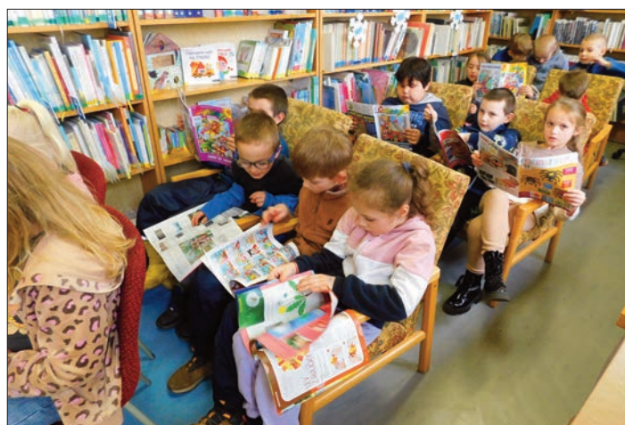
1. třída - volné prohlížení