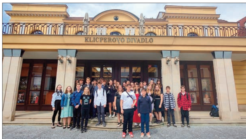
Návštěva Klicperova divadla v Hradci Králové

Co dodat? Do divadla jsme se vždycky opravdu těšili a žádné představení nás nezklamalo. Už teď se těšíme na další představení