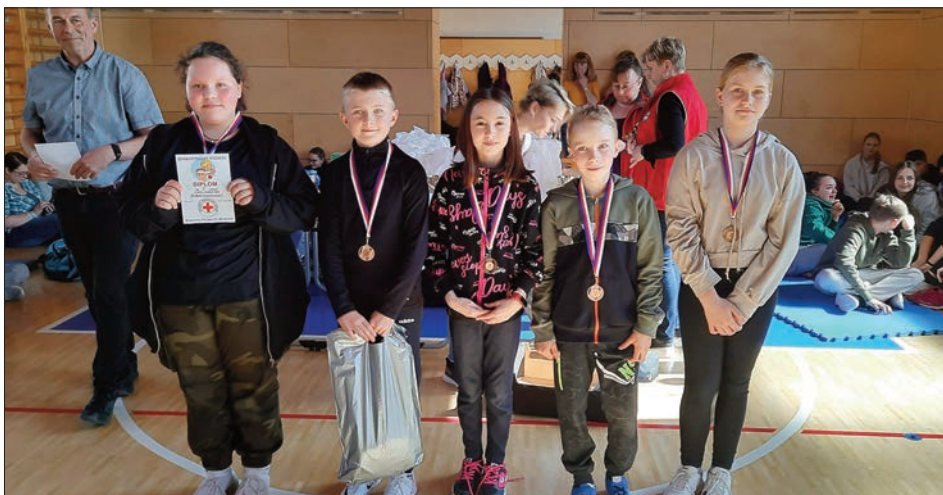
Hlídka mladších žáků 3. a 1. místo