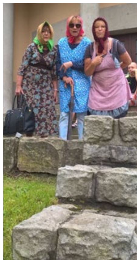
Přišly tam opruzovat tři baby. Poznáte je?