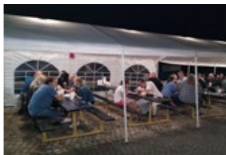
Hospůdka Na plotě žila dlouho do noci.

Financování činnosti ochotnických spolků je různé, spolek od spolku. My se už od nepaměti snažíme o co možná největší samostatnost, což se nám i díky pouťovým bramborákům, ale taky letní hospůdce Na Plotě celkem daří. Navíc díky vstřícnosti Městského kulturního střediska a potažmo vedení města máme pro zkoušky i nějaké úlevy na nájemném a energiích. Pokud jde o nějakou mimořádnou záležitost, můžeme využít vypisovaných grantů. Když to takhle bude fungovat i nadále, problém se zaplacením vzniku nové inscenace bychom mít neměli