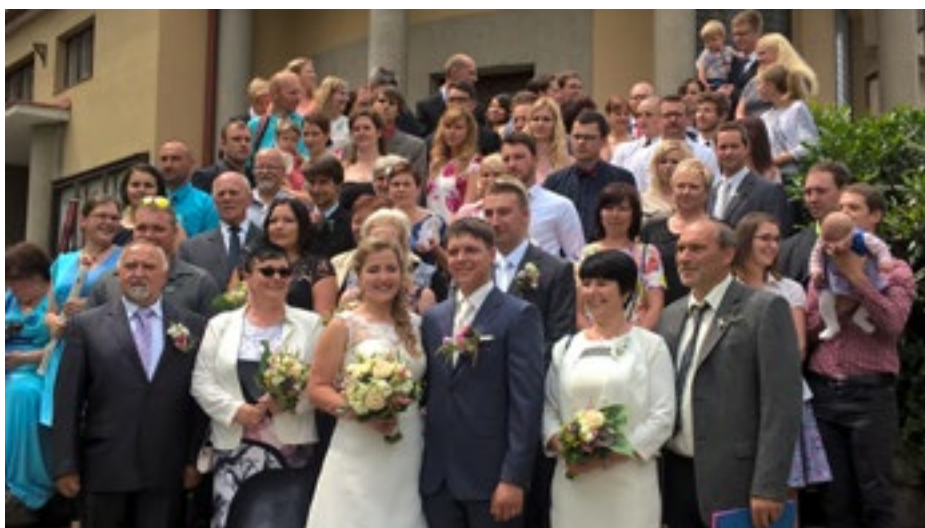
A tady je to komplet. Držíme vám palce!