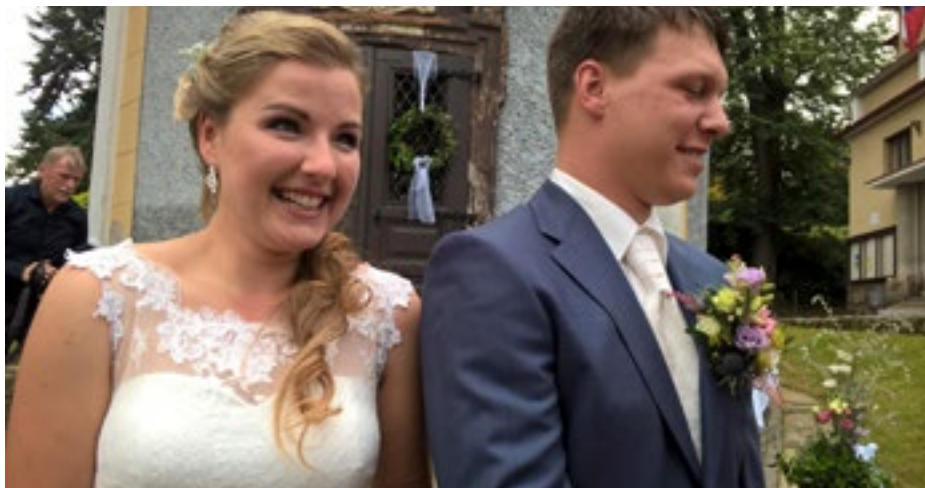
Teď už Machovi!