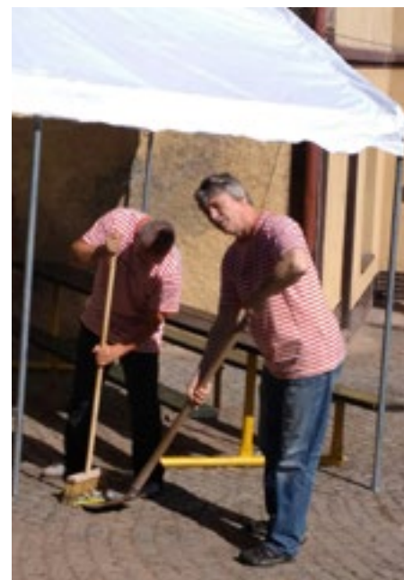
Náš předseda to má pevně v rukou!