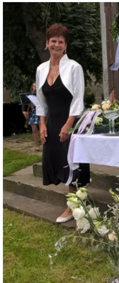
Díky Janě jsme to měli pod kontrolou.