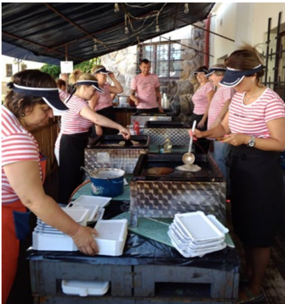
Který spolek tohle má?