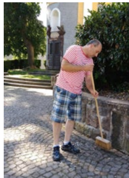
Nové koště dobře metě!