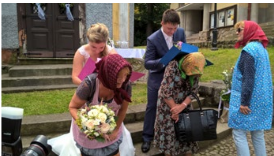
Byla z toho velká legrace, ale svatečkané dostali hlad, než novomanželé dotazník vyplnili.