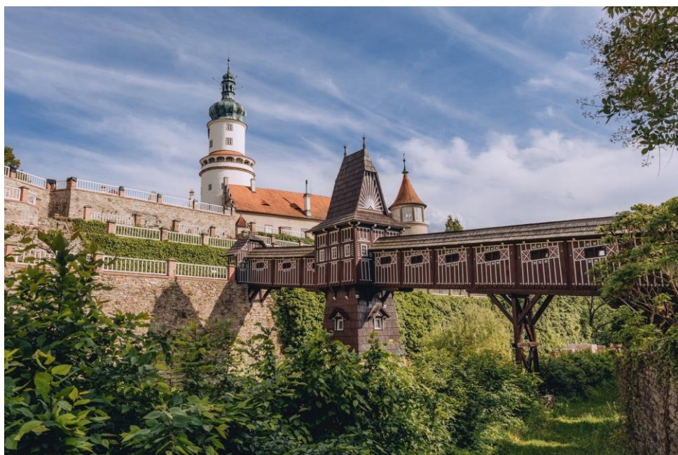
Most u novoměstského zámku