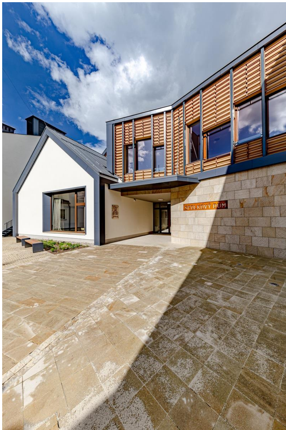
Spolkový dům v Náchodě